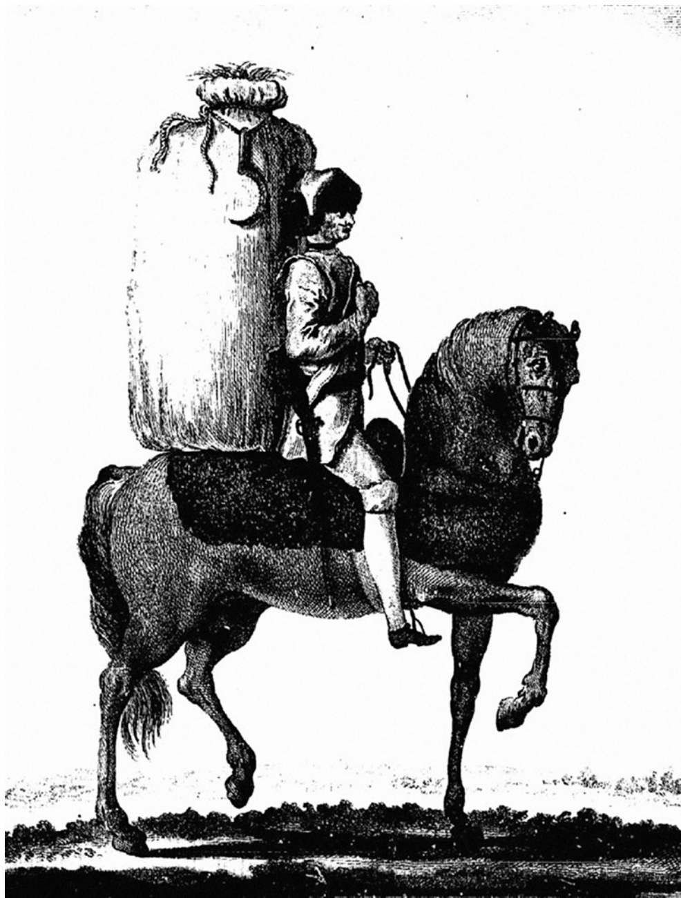
Furażer – rycina z Mes rêveries Maurycego Saskiego ( http://www.kronoskaf.com )