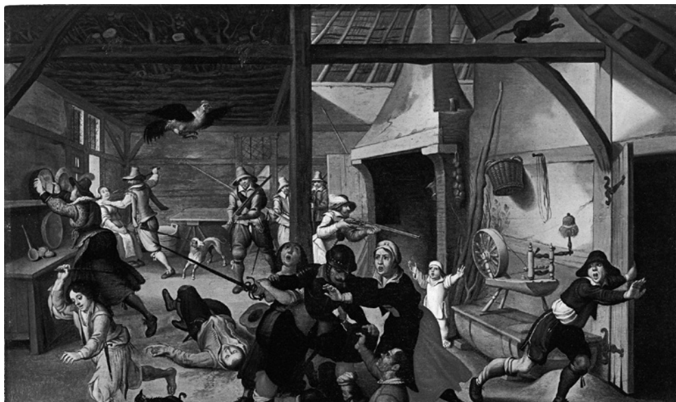
Żołnierze plądrują gospodarstwo wiejskie podczas wojny trzydziestoletniej. Obraz Sebastiana Vrancxa.