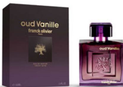
Autorki listów otrzymują zapach unisex FRANCK OLIVIER OUD VANILLE dostępny w sieci Drogerie Natura.