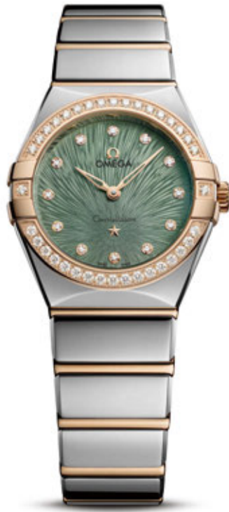
CONSTELLATION 28 MM