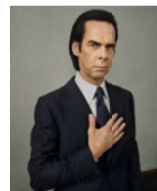
Na okładce: NICK CAVE

Listopadowy numer „Zwierciadła” w sprzedaży od 2 października.