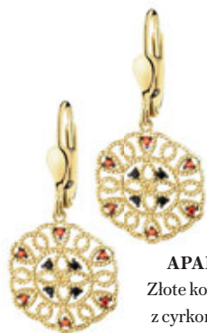
APART Złote kolczyki z cyrkoniami 1569 zł.

W roli głównej jabłka z grójeckich sadów. Nie tylko do szarlotki. Jabłka w musach, galaretkach, cydrach, wytrawnych salatkach. Plus pasjonująca historia zapomnianych odmian tych owoców.