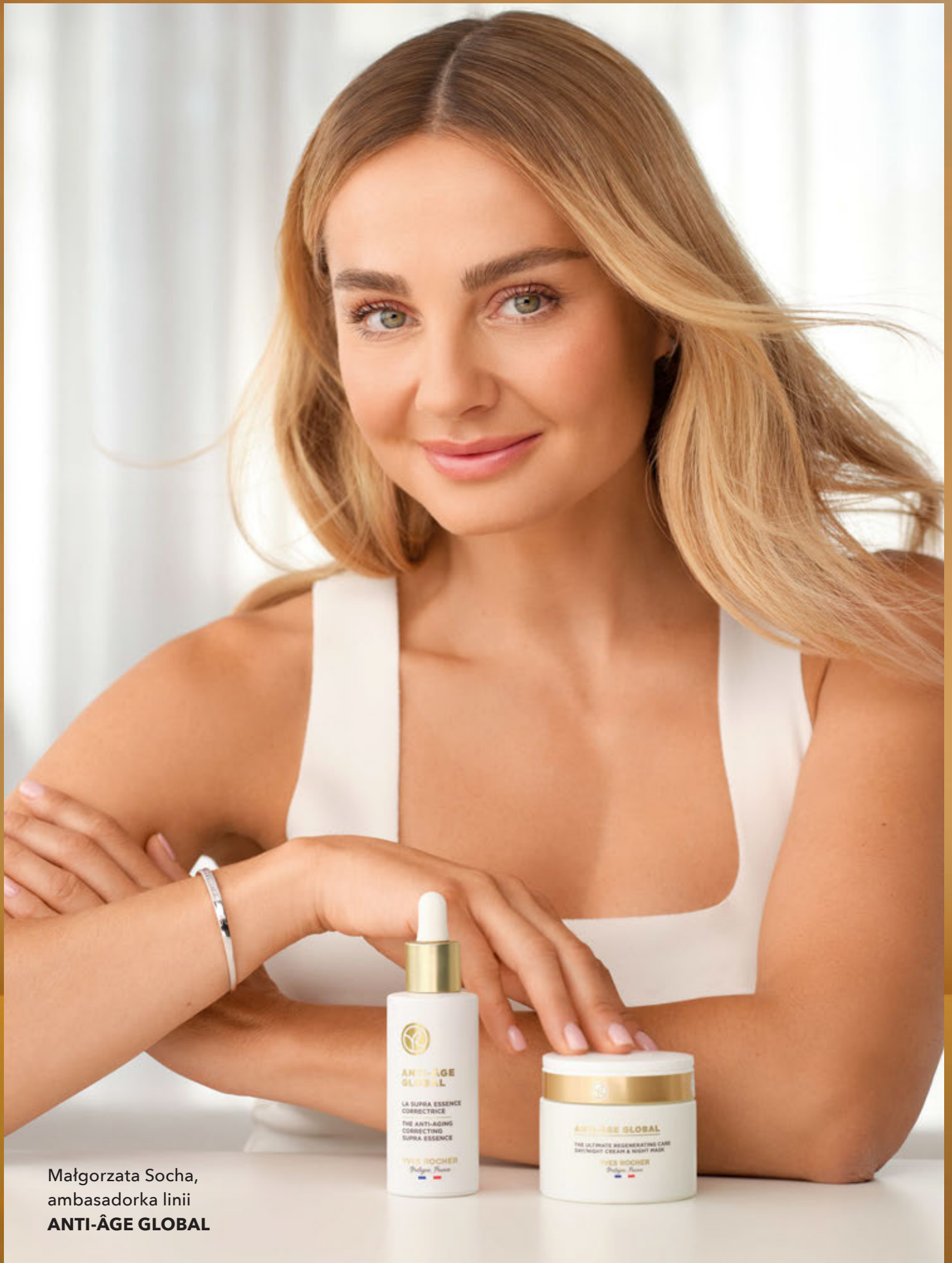
Małgorzata Socha, ambasadorka linii ANTI-ÂGE GLOBAL