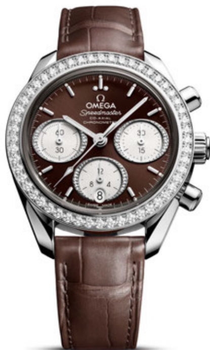
SPEEDMASTER 38mm Co-Axial Chronometer