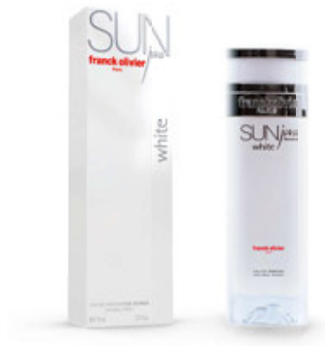
Autorki listów otrzymują wodę perfumowaną Franck Olivier SUN Java White.

P rzeczytawszy artykuł „Gdyby rodzice chodzili na terapię” z lipcowego numeru, pomyślałam: tak mógłby wyglądać raj! Opis emocjonalnie niedojrzałego rodzica trafiony w dziesiątkę! Mam 30 lat i od wielu lat rozmyślam o swoim dzieciństwie i roli rodziców w tym spektaklu. Z przykrością stwierdzam,