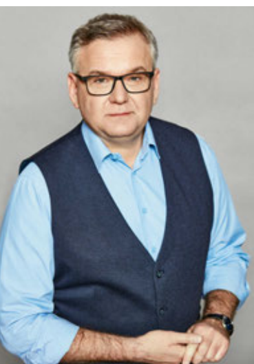
ARTUR ANDRUS Mistrz Mowy Polskiej, dziennikarz, poeta, autor piosenek.

A gdyby w krzyżówce było: „po łacinie Perdix perdix , ale zdrobniale”, szwagier wpisałby „kuropatwka”. I nikomu nic do tego, że o jedną literę za mało!