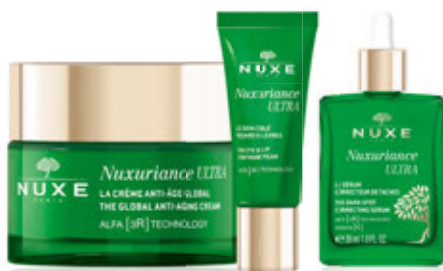
Autorce listów otrzymują zestaw kosmetyków NUXE Nuxuriance ULTRA.

O d dawna chciałam jechać do Pragi. Słyszałam, że to piękne miasto, pełne historii, zabytków i uroku, ale jakoś nigdy nie było okazji, czasu, możliwości. Zawsze coś stało