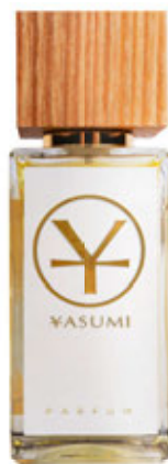
Autorki listów otrzymują perfumy inspirowane Japonią YASUMI HATO.

O lga Bończyk w tekście „Tłumaczka” [„Z” nr 6/2021]. poruszyła bardzo ważny temat pokonywania mostów między