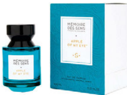
Autorki listów otrzymują wodę perfumowaną MÉMOIRE DES SENS APPLE OF MY EYE.

T ekst „Bez pancierza” z sierpniowego „Z” poruszył bardzo ważny dla mnie temat depresji u mężczyzn. Na przykładzie mojego brata sama doświadczyłam, jak ta choroba może zmieniać człowieka i jak łatwo przegapić jej objawy. Od panów od małego wymaga się braku