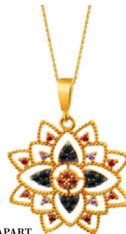
APART Złota zawieszka z cyrkoniami, 879 zł.

Ubrania dobrze skrojone, czyli kolekcja Pre-Fall Proenzy Schouler. Wjźdź w jesień pewnym krokiem.