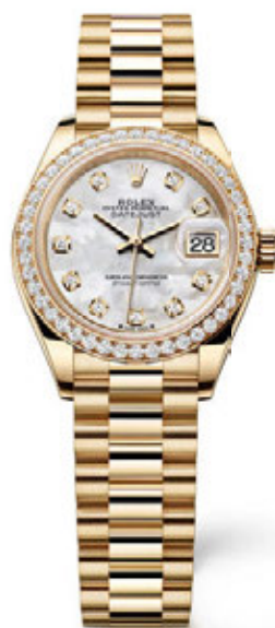
OYSTER PERPETUAL LADY-DATEJUST