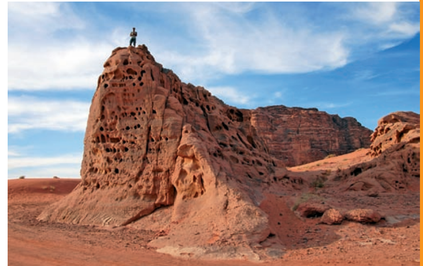
Dolina Wadi Rum

i jałowa pustynia Arava, rozciągająca się aż do zatoki Akaba, stanowiącej część Morza Czerwonego. Rów Jordanu, Morza Martwego i Arawy stanowi granicę z Syrią i Jordanią – faktycznie jednak do Izraela należy także (jako terytorium okupowane) niewielki region położony na wschód od Jordanu, tj. wzgórze Golan. Stanowią one przedłużenie ku południowi pasma górskiego Antylibanu, którego najwyższy szczyt – góra Hermon (2800 m n.p.m.) leży na granicy Libanu i Syrii. Wzgórze Golan opadają ku dolinie Jordanu stromą krawędzią, pociętą licznymi głębokimi dolinami i wąwozami, zaś na rozciągającym się w głębi płaskowyżu wyrastają stożki kilku nieczynnych wulkanów. Od południa granicę wzgórz stanowi rzeka Jarmuk, którą przebiega także granica z Jordanią.