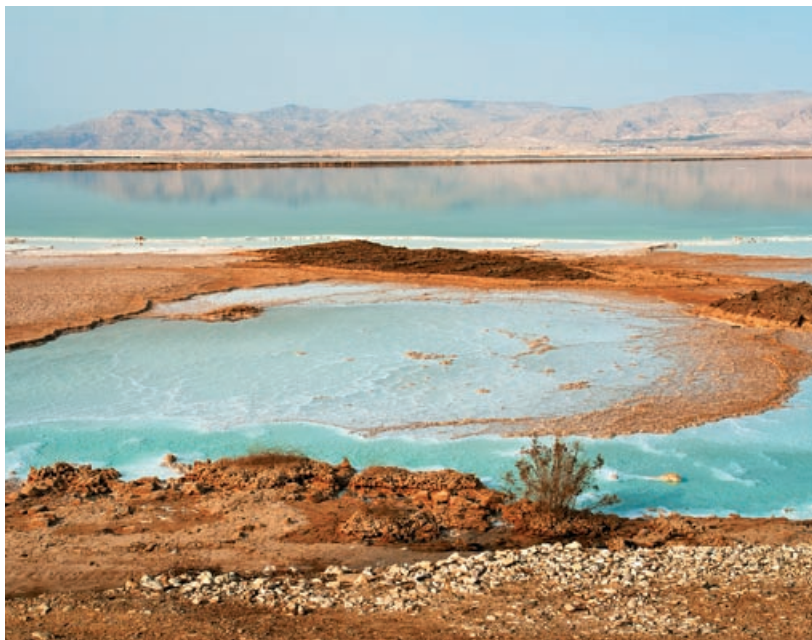
Morze Martwe – najbardziej zasolony akwen świata

rewizje lub protesty palestyńskie powodują ogromne kolejki przy tych punktach, wydłużając w nieskończoność czas jazdy z miasta do miasta. Niektóre posterunki można z kolei pokonać tylko pieszo. Brakuje tu sprawnej i wygodnej komunikacji autobusowej, wyjątkiem są miejscowości nad Morzem Martwym.