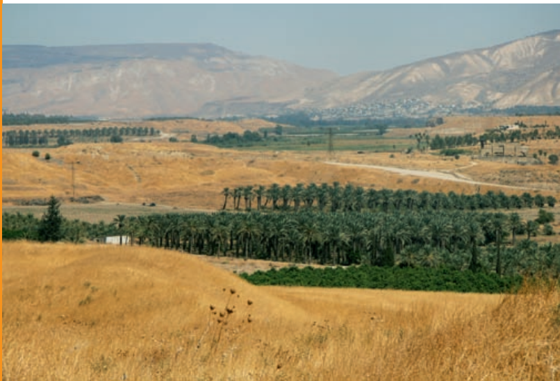
Dolina Jordanu w okolicy Bet Sze'an

Wyżyny ograniczone są od wschodu stromym progiem, opadającym do Rowu Jordanu i Morza Martwego. Ta szeroka dolina stanowi przedłużenie wielkiego rowu tektonicznego, w którym leży również Morze Czerwone, a który dalej na południe ciągnie się przez Etiopię i całą Afrykę Wschodnią jako Wielki Rów Wschodnioafrykański. Przez północną część tego obniżenia płynie najdłuższa w Izraelu rzeka Jordan (251 km), której źródła znajdują się na terenie Libanu w górach Antylibanu. Jordan spływa najpierw ku wodom Jeziora Galilejskiego, które jest największym słodководnym akwenem w Izraelu, a następnie przez coraz dziksze i bardziej suche tereny aż do Morza Martwego. To bezodpływowe, ekstremalnie zasolone jezioro leży w najgłębszej depresji na świecie (418 m p.p.m.). Przedłużeniem Rowu na południe jest dolina Arava, którą zajmuje sucha