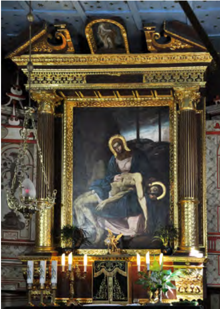
Ołtarz główny Matki Boskiej Bolesnej

Zachowały się polichromie gotyckie na najstarszych belkach oraz renesansowe zdobiące większą część świątyni.