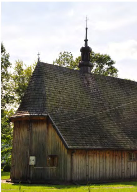
Elewacja północna i wschodnia

Najstarsze części to prezbiterium (zamknięte wielobocznie) i przednia część nawy. Przy prezbiterium znajduje się dawna kruchta i zakrystia.