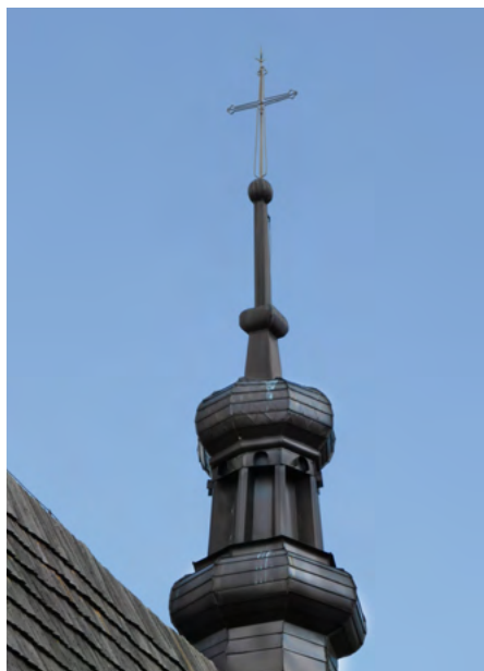
Sygnaturka, elewacja południowa