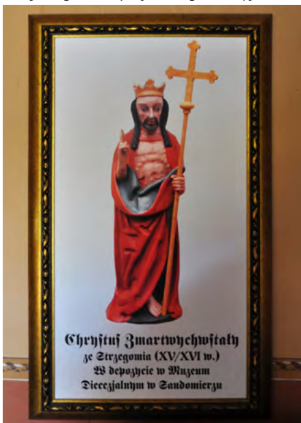
Chrystus Zmartwychwstały ze Strzegomia (XV/XVI w.) W depozycie w Muzeum Diecezjalnym w Zandomierzu