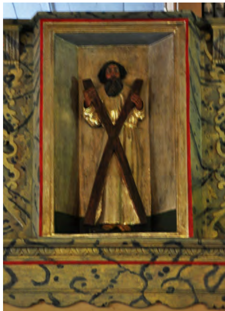
Rzeźba św. Andrzeja