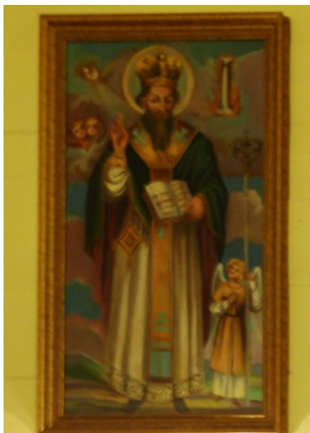
Święty Bazyli, na ścianie południowej Rzeźba św. Bazylego