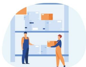
1. towary handlowe