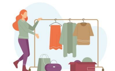
5. wyroby gotowe