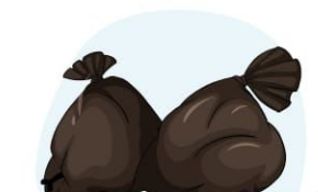
6. braki i odpady