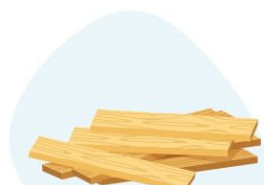
2. materiały (surowce) podstawowe i pomocnicze