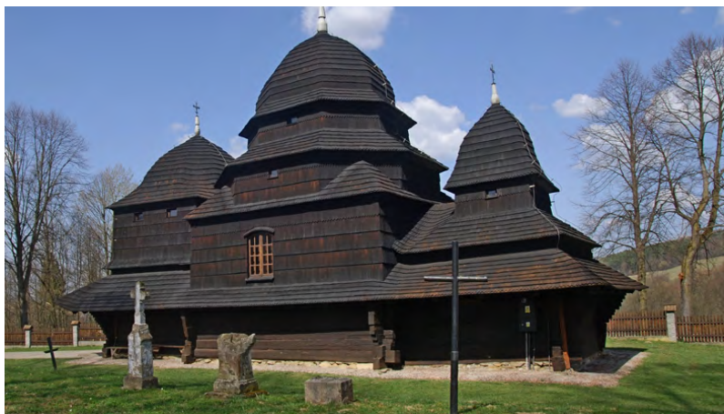
Cerkiew w Równi

Wielu turystów rozpoczyna swoją przygodę z Bieszczadami właśnie w Komańczy, przez którą prowadzi Główny Szlak Beskidzki. W przełomowym dla naszego kraju listopadzie 1918 roku kilkadziesiąt okolicznych wsi utworzyło tak zwaną Republikę Komańczańską. Przywódcami ruchu byli duchowni grekokatolicki, którzy chcieli przyłączyć te ziemie do Zachodnioukraińskiej Republiki Ludowej. Na zasadzie pospolitego ruszenia utworzono milicję. Na Żydów został nałożony dodatkowy podatek na rzecz jej utrzymania.