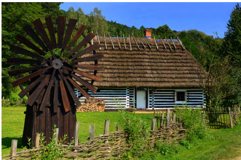
Charakterystyczna dla ziemi sanockiej zagroda prezentowana w skansenie

W 1339 roku książę halicko-włodzimierski Bolesław Jerzy II nadał Sanokowi prawo miejskie na regule magdeburgskiej. Miasto od dnia lokacji było zamieszkiwane przez wiele narodowości i dynamicznie rozwijało się, korzystając ze swojego położenia na pograniczu polsko-węgierskim, na szlaku handlowym na Ruś. Zabytkiem pamiętającym średniowieczną i nowożytną historię grodu nad Sanem jest zamek królewski, z którego roztacza się piękny widok na rzekę.