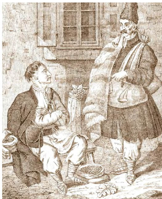
Bojkowie na rycinach z pierwszej połowy XIX wieku (domena publiczna)