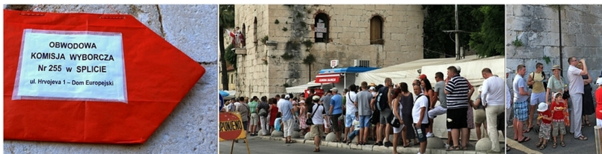
Kolejka do Komisji Wyborczej

– Do you know how long we have to wait? – powtarzam pytanie po angielsku.