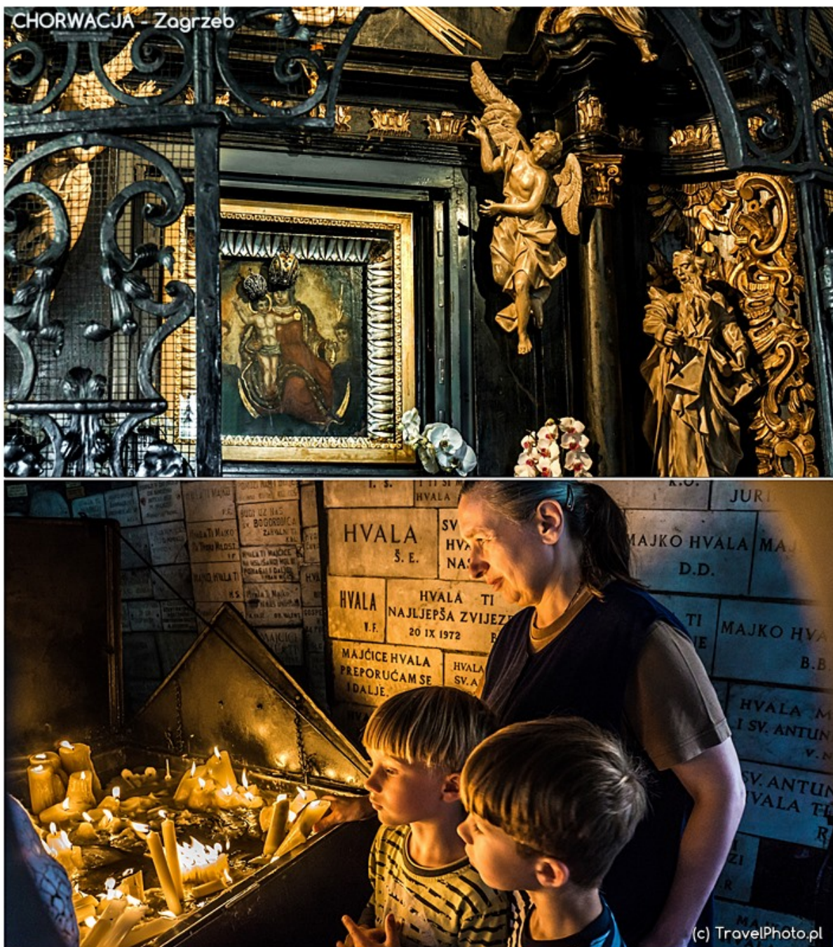
Matka Boża, która broniła Zagrzebia...

Jeszcze kilka kroków ul. Kamenita (Kamienną) i jesteśmy na placu św. Marka. Jego najbardziej znanym zabytkiem jest kościół św. Marka z dachem pokrytym barwną szachownicą, na której umieszczono