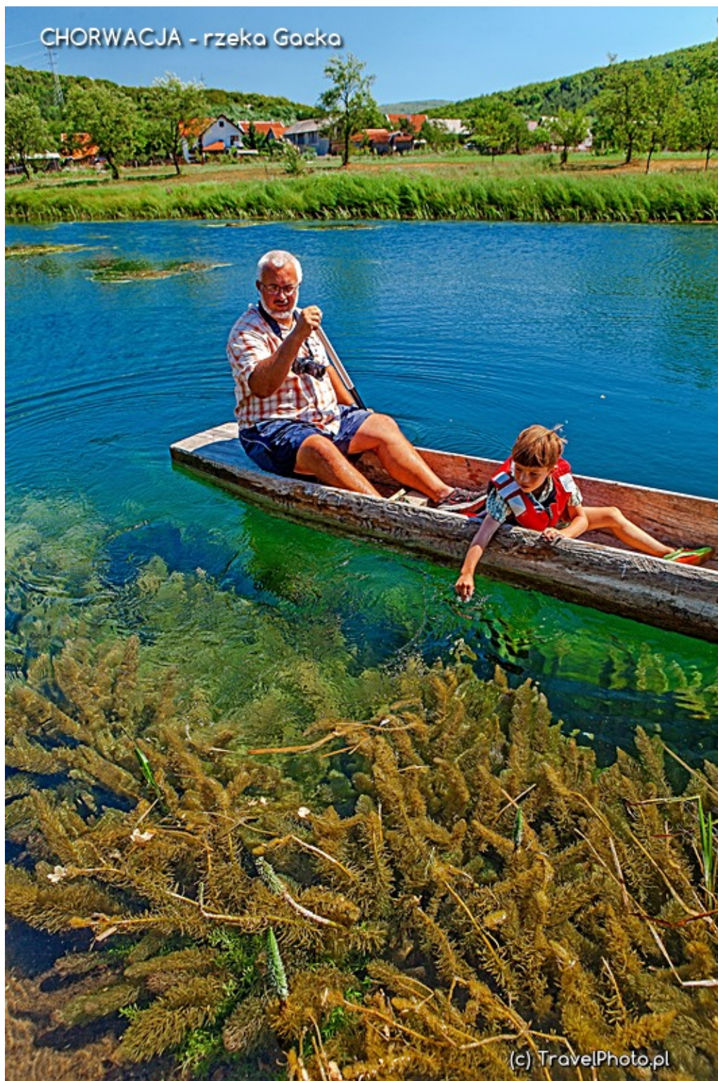
Widać rolniczy skarb w rzece - wodorosty.