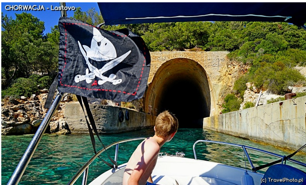
Schron dla okrętów podwodnych.

Są też bunkry z działami skierowanymi w stronę morza i opuszczone koszary, w miejscu o złowrogo brzmiącej nazwie Zle Polje. Poszukiwacze skarbów nic tu nie znajdą bo baza została dobrze wyczyszczona, ale warto tu zajrzeć na kilkuminutowy spacer. Najciekawsze są dawna stołówka, szpital i koszary. Znajdziecie tu mural i emblemat jednostki przy wartowni. Rosną tu największe palmy na wyspie, a sama baza ukryta jest pod wiekowymi sosnami.