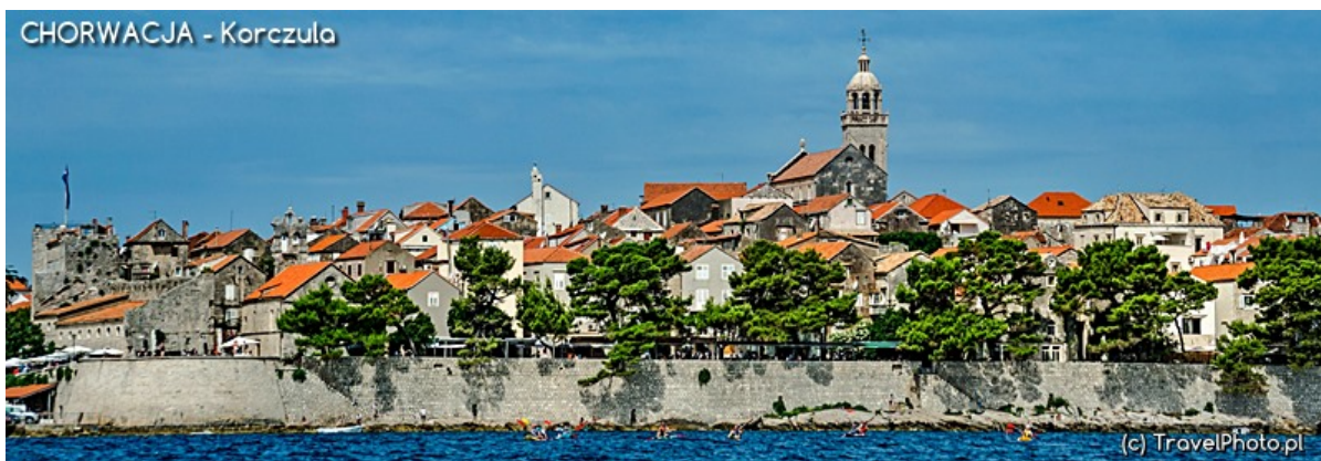
Panorama miasta z morza.

Tu także miał się urodzić naj słynniejszych podróżników: Marco Polo. Ale powodów by odwiedzić Korczulę znajdzie się zdecydowanie więcej. Lazurowa woda, malutkie wysepki i piękne stare miasto oferują w pigułce to, co najlepsze w Chorwacji.