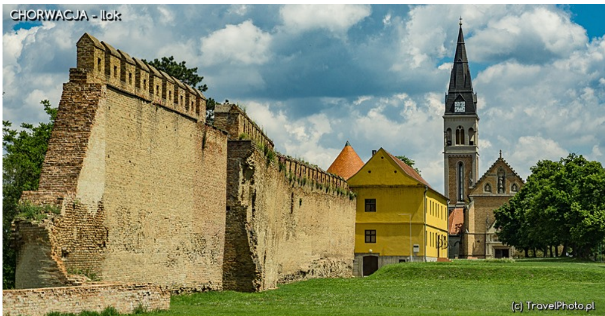
Mury obronne, zamek, unikalny kościół z klasztorem,...