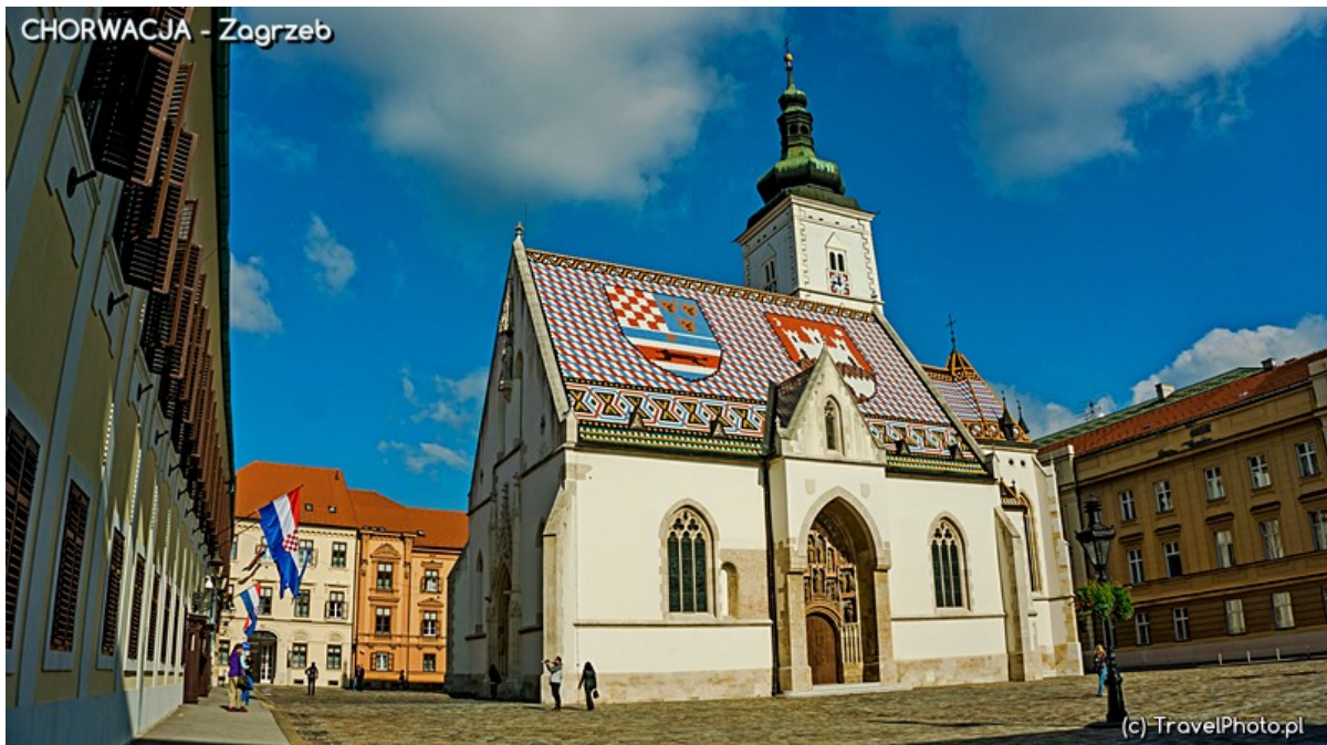
Kościół św. Marka.

herby Zagrzebia i Chorwacji. Jak dawnym mistrzom udało się stworzyć tak precyzyjne arcydzieło?