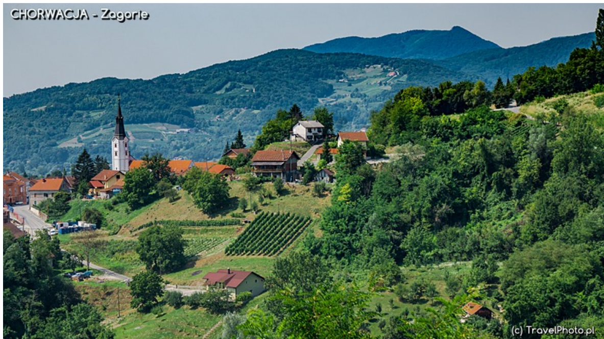
Typowy krajobraz Zagoria!

Zatrzymaj się po drodze i zachwyć tym niezwykłym zakątkiem! Zagorie to piękne krajobrazy. Zielone wzgórza z domami krytymi czerwoną dachówką i winnicami, drogi poprowadzone często grzbietami dzięki czemu oferują wspaniałe widoki.