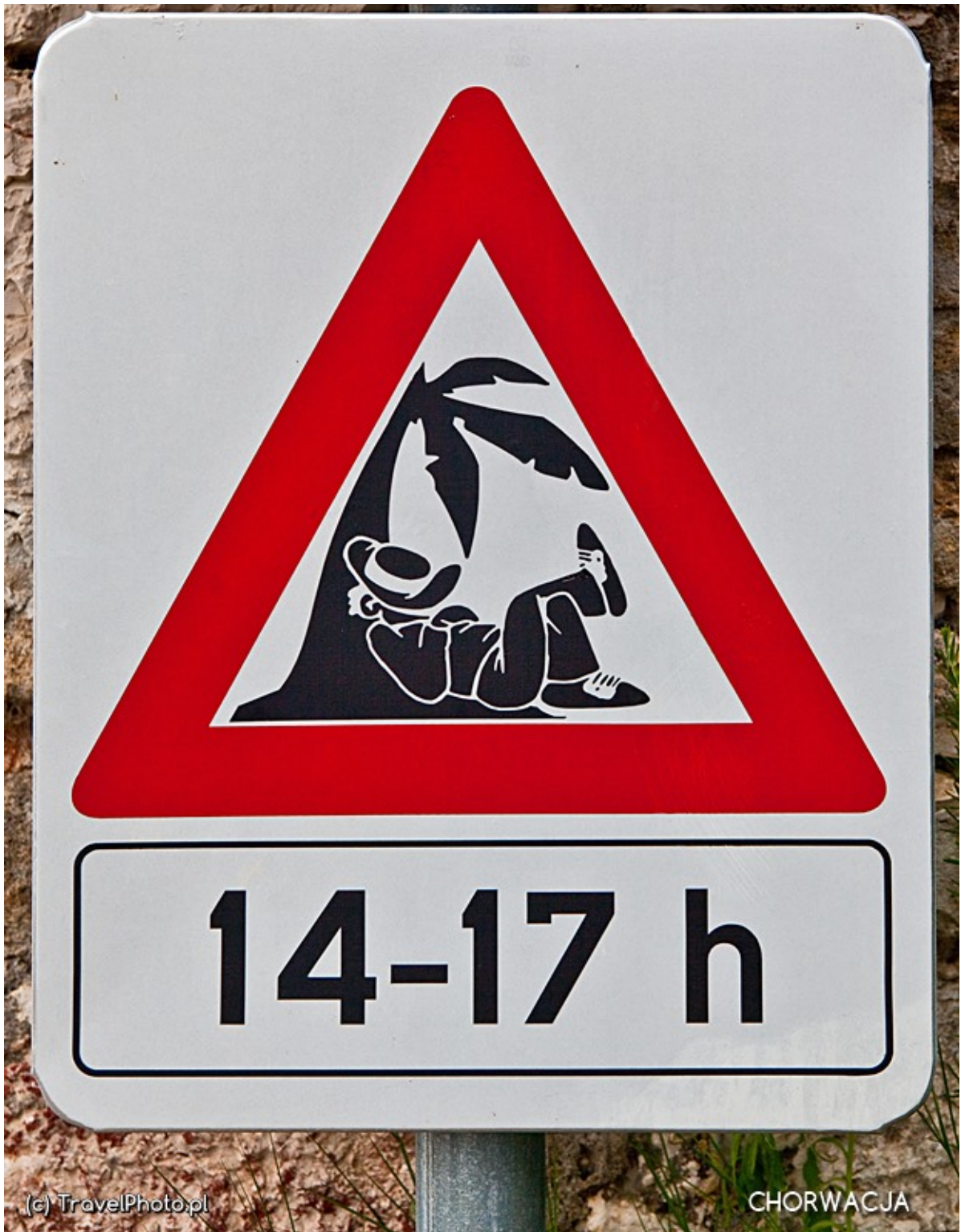
Na chorwackich wyspach czas płynie inaczej.