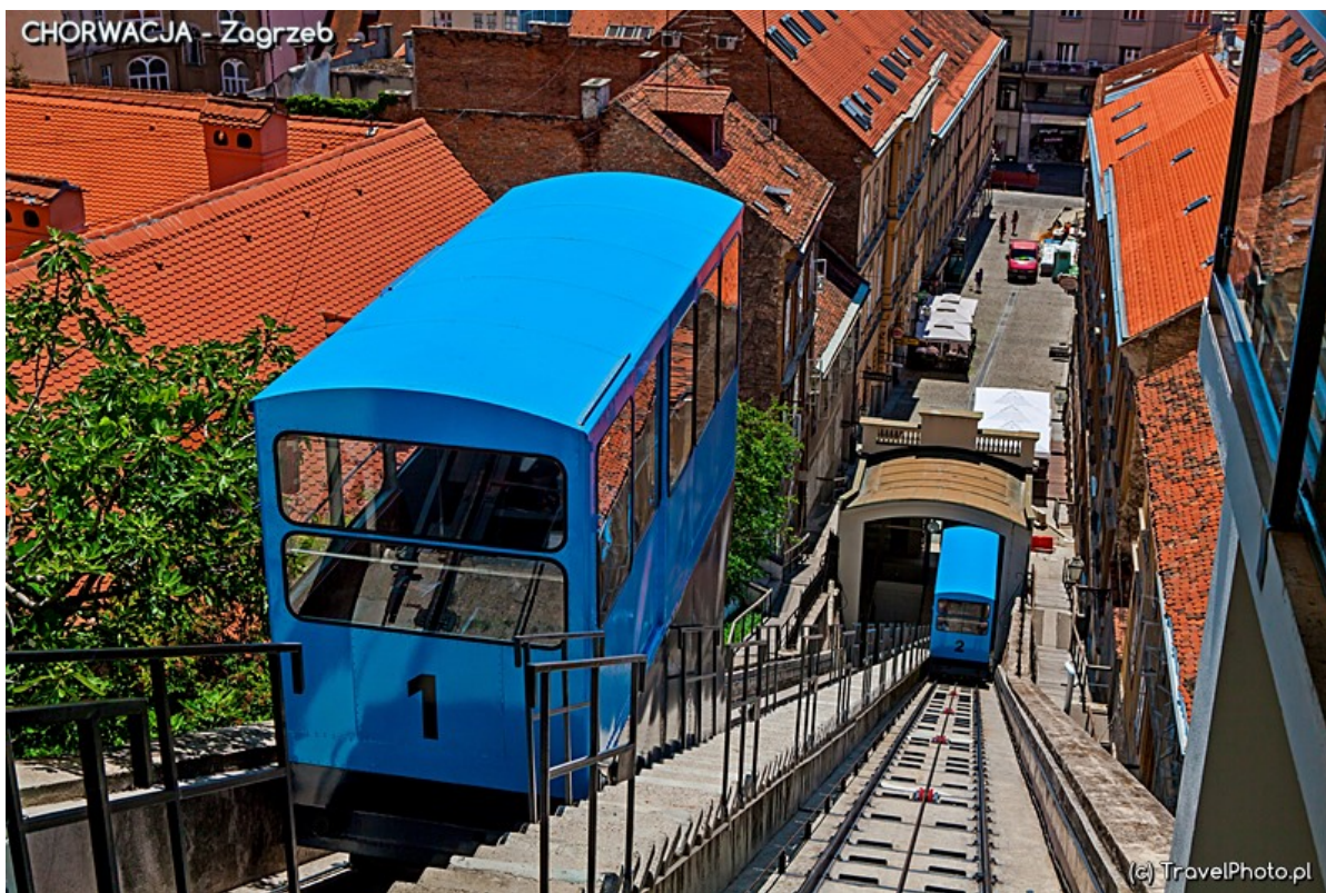
Kolejka łączy dolne i górne miasto.

Jej niezwykłość polega na tym, iż we wnętrzu znajduje się niewielki ołtarzyk z cudownym wizerunkiem, a wszystkie ściany (okopcone od palących się bezustannie wotywnych świec) są wyłożone dziękczynnymi tabliczkami.