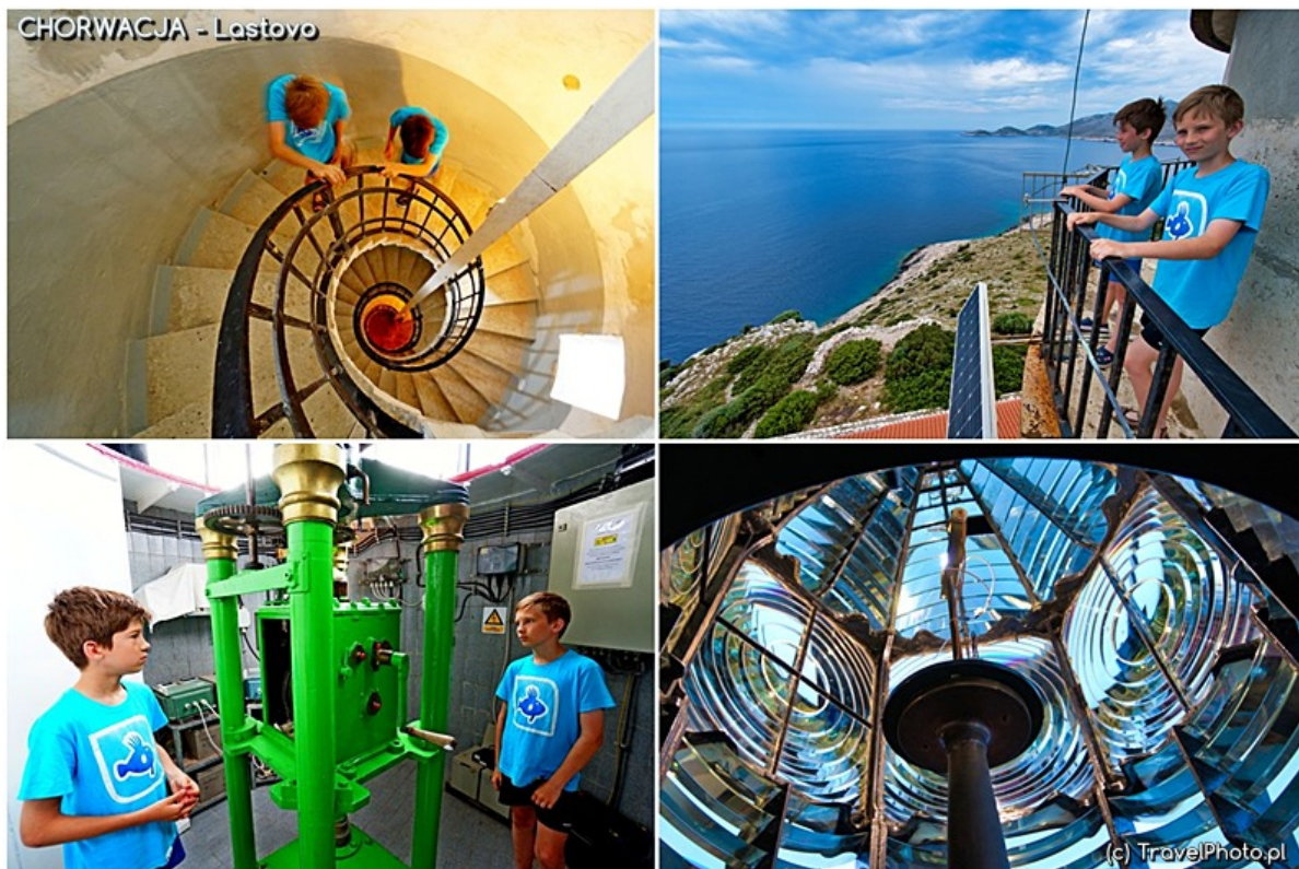
Wnętrze latarni morskiej.

Kolejnym skarbem wyspy jest jedyne na niej miasteczko: Lastovo. Być może jego nazwa pochodzi do jaskółki (po chorwacku: lastavica), bo domy zbudowane na zboczu góry wyglądają niczym jaskółcze gniazdo. Stare domy pochodzą z XV i XVI wieku. Zrobione z miejscowego, białego kamienia chronią przed upałem latem i zimną burą.