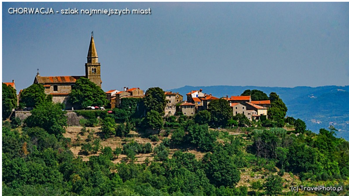
Groznjan na szlaku najmniejszych miast

miasteczkiem artystów. Taki polski Kazimierz nad Wisłą, tyle że nie drewniany, a kamienny i nie nad rzeką, a na szczycie góry. Gdy zaparkujemy auto i wyruszymy na spacer jego uliczkami zobaczymy całą masę malowniczych widoków. Nic dziwnego, skoro w większości domów działają pracownie artystyczne, a ich twórcy prześcigają się w stylowym pokazaniu swoich dzieł.