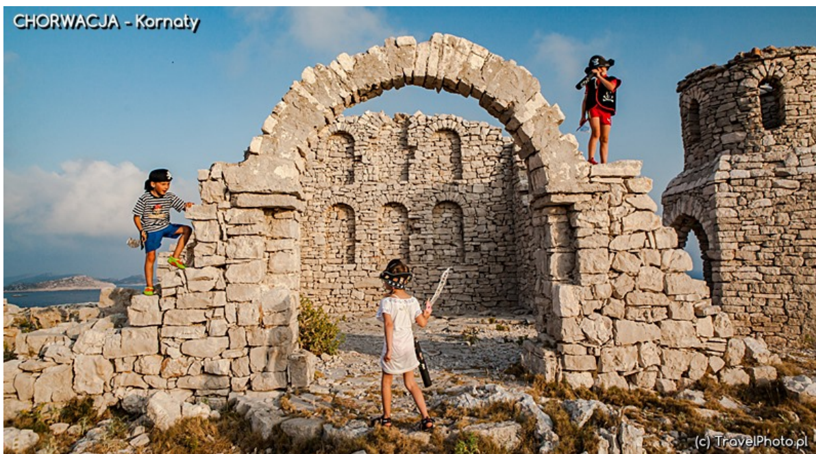
Zabawa w piratów w dawnej scenografii filmowej.