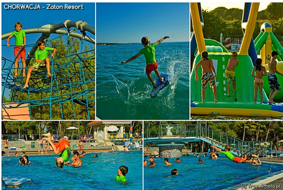
Wodny raj dla dzieci.

Znajduje się tu największe zaplecze noclegowe Ninu czyli Zaton Holiday Resort. To kolejny ogromny camping należący do najlepszych campingów w Europie. Jest duży, ale zwarty więc nie przeraża perspektywa kilometrowej wędrówki do plaży. Nie jest to tylko camping stąd nazwa resort.