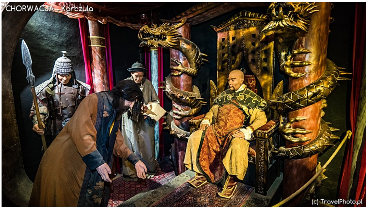
Marco Polo na dworze mongolskiego chana - scena z muzeum.

Jako słynna osoba był traktowany z szacunkiem i wielokrotnie proszono go o opowiedzenie swoich wspomnień.