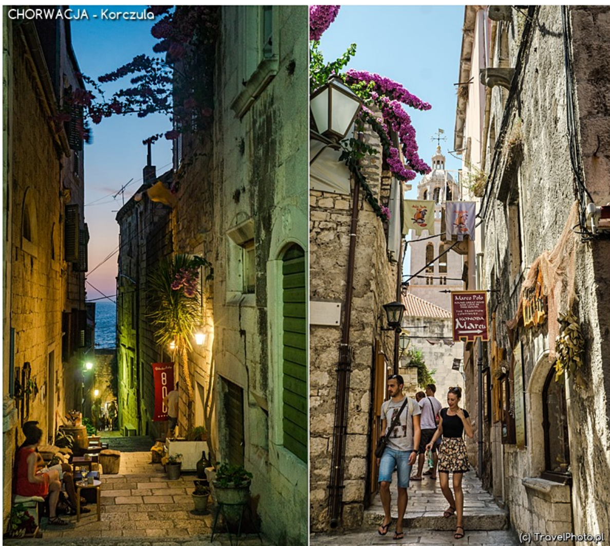
Uliczki Korczuli dostępne tylko dla pieszych.

Najlepiej na Korczulę przyjechać właśnie jesienią, gdy już nie ma tłumów i można spokojnie przysiąść w jednej z urokliwych kawiarni składających się czasem z ledwie kilku stolików. Urok miasta tworzą zabytkowe kamienne domy, gdzie na fasadach znajdziemy herby dawnych właścicieli. To właśnie w jednym z takich domów miał się urodzić w XIII w. Marco Polo.