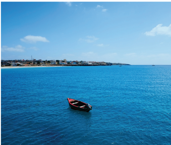
Vila do Maio