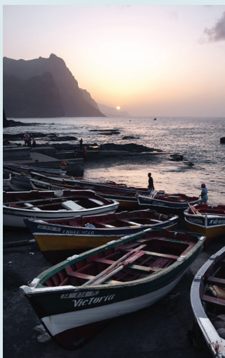
Ponta do Sol

Podziwianie doświadczonych surferów , którzy w Ponta Preta rzucają wyzwanie błękitnym wodom i falom rozbijającym się o jedną z najpiękniejszych plaż na Sal (s. 27).