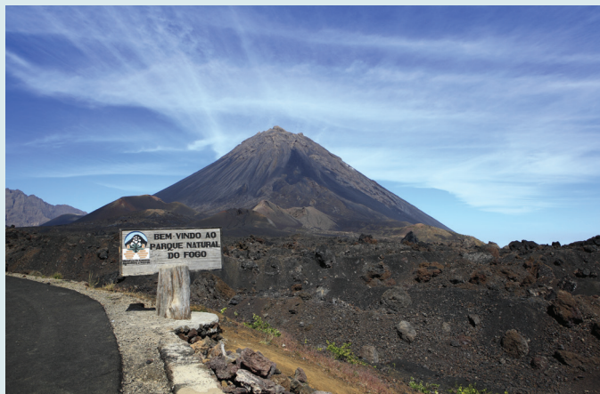
Pico do Fogo

Po pobycie na wyspie Brava (dzień 7–8) można wybrać bardziej klasyczny program zwiedzania na drugi tydzień. Warto połączyć pobyt w Mindelo na wyspie São Vicente z wędrówką szlakami na Santo Antão lub zdecydować się na tygodniowy odpoczynek na plażach na wyspach Sal i Boa Vista. Dwie ostatnie opcje: zob. „Wyspy Zielonego Przylądka w 1 tydzień”, s. 8.