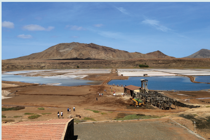
Pedra de Lume