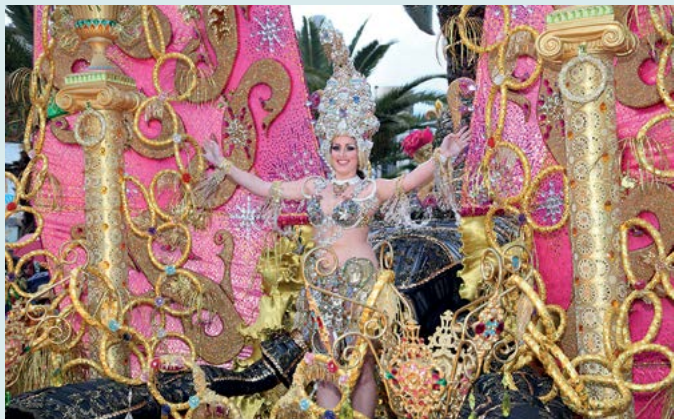
Karnawał w Santa Cruz de Tenerife

To największy tunel wulkaniczny w Unii Europejskiej. Podczas wycieczki z przewodnikiem można zwiedzić fragment jaskini i obejrzyć zadziwiające formacje skalne (zob. s. 74).