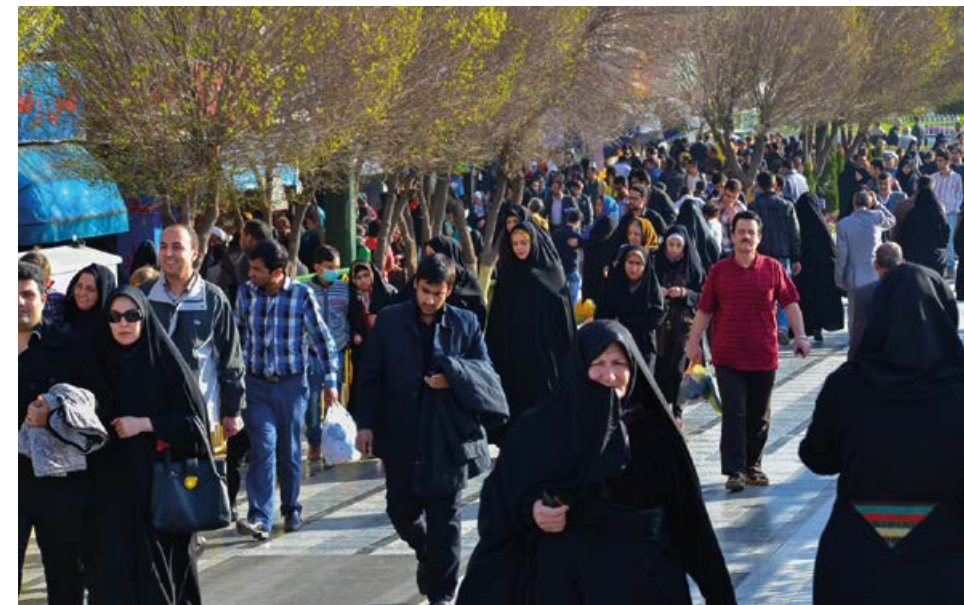
● Ulicą prowadzącą do miejsca pochówku wielkiego męża płynie rzesza ludzi

Przed najważniejszym meczetem Goharszad stoi strażnik z zabawną miotełką. Na mój widok zaczyna nią machać, jakby chciał odpędzić zło. Daje do zrozumienia, że muszę bardziej zasłonić się czadorem. Nie wiem, w jaki sposób mogę się jeszcze bardziej zakryć. Prostokątna płachta materiału zsuwa mi się na oczy i dość skutecznie utrudnia ruchy. Jest za długa i chwilami naprawdę nie do okiełznanania. Chyba się zaraz uduszę w tym kawałku nylonu, a tu jeszcze słyszę, by nie pokazywać grzywki. Zamiast rozglądać się na boki, kurczowo ściskam gładki materiał.