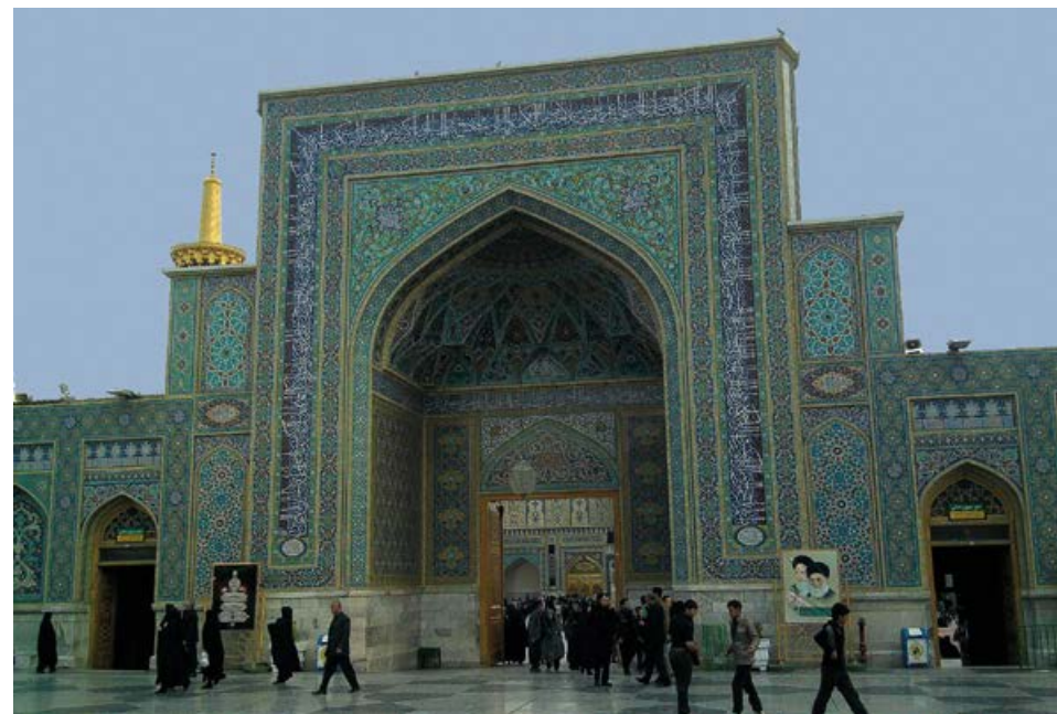
● Ściany pokrywają wzory z fajansowych płytek

Meczet został zbudowany w 1418 roku na polecenie Goharszad, sułtańskiej żony, jako miejsce zgromadzenia dla pielgrzymów odwiedzających grób imama. Świątynia z jednej strony przylega do mauzoleum, a z drugiej do nowego dziedzińca Quds. Ten jak najbardziej można obejrzeć. Pośrodku stoi Saqqa Khaneh, czyli studnia z wodą pitną. Dla szyitów zapewnienie dostępu do wody w miejscach publicznych jest ważnym symbolem. W ten sposób upamięniają i często tragiczne wydarzenia spod Karbali, gdy wnuk proroka wraz z towarzyszami, odcięci od wód Eufratu, nie mogli ugasić pragnienia. Ozdobna studnia na dziedzińcu Quds powstała w 1990 roku, a za wzorzec posłużyła jerozolimską Kopuła na Skale. Pokryta złotem czasza błyszczą na tle, zdobionej kolorowymi płytkami, zewnętrznej ściany meczetu Goharszad.