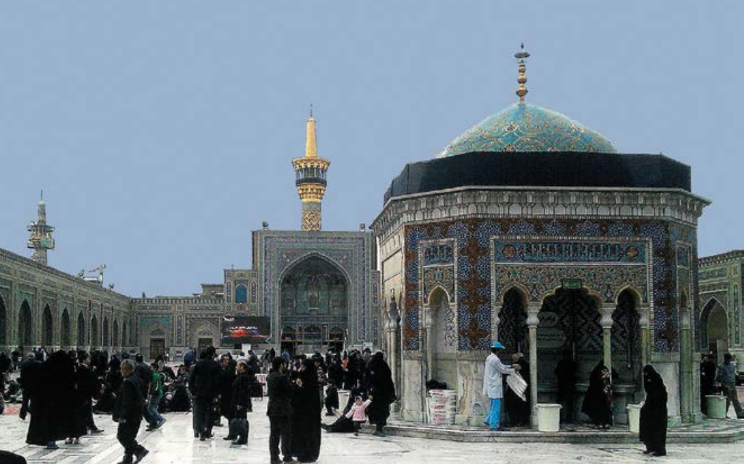
● Pielgrzymi licznie wędrują do świętego przybytku ze swoimi prośbami i podziękowaniami

Dopiero później poznaję tajemnicę mojego pierwszego nieudanego występu w czadorze. Lata treningu i doświadczeń sprawiają, że Iranki radzą sobie z tym okryciem doskonale. Rozkloszowany kawałek porządnej bawełnianej tkaniny przede wszystkim nie zsuwa się tak łatwo z ramion, jak mój wypożyczony strój.