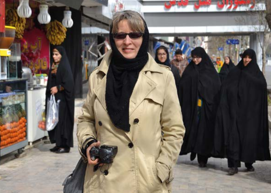
● Jasny prochowiec wyróżnia mnie dość mocno na tle miejscowych kobiet

twarze, ale nierzadko spod czarnych zasłonek wychwytyją spojrzenia pełne ciekawości.