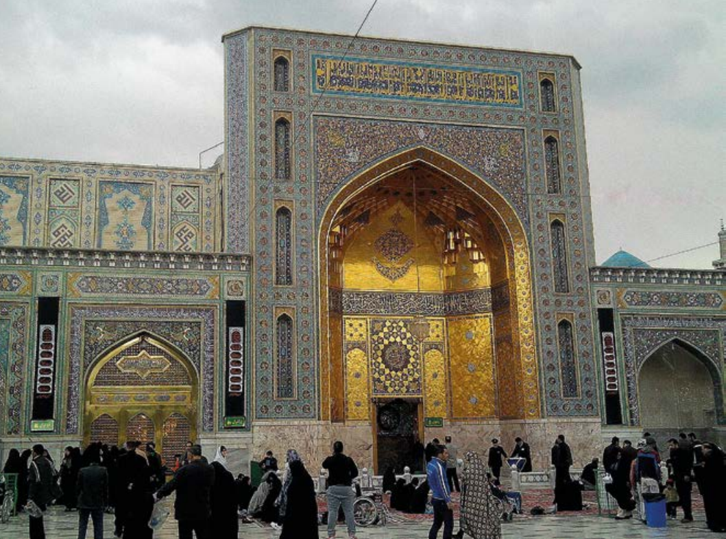
● Do mauzoleum imama Rezy prowadzą złote bramy

odprowadzeniem na wieczny spoczynek. Na wielkich świątynnych placach raz po raz widoczni są żałobnicy, dźwigający proste trumny.