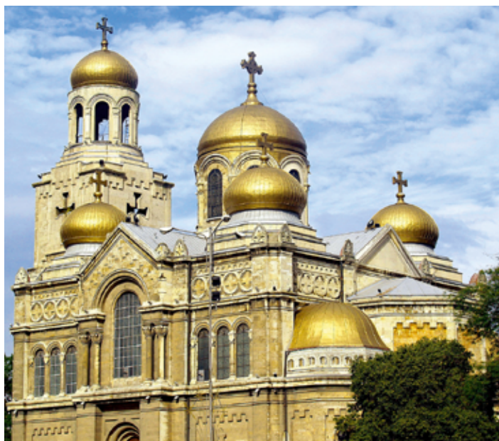
▲ Cerkiew Zaśnięcia Bogurodzicy w Warnie

nowożytnym i współczesnym kulturom mieszkającym się i koegzystującym tutaj w kolejnych stuleciach. Warna jest dziś poważnym rywalem Sofii i Płowdiwu, konkurując z nimi nie tylko gospodarczo, lecz przede wszystkim poziomem życia kulturalnego, liczbą zabytków, muzeów i galerii sztuki. Działa tu komunikacja miejska – średnio co 20 min odjeżdżają stąd autobusy linii 409, które jadą z lotniska, przez dworzec autobusowy i przez centrum aż do Złotych Piasków (bilety sprzedaje konduktor). Można również wsiąść do autobusów nr 9 i 109 (przyspieszonych), jeżdżących spod katedry w centrum Warny aż do Złotych Piasków. Przy lotnisku jest postój taksówek, więc w razie potrzeby można z nich skorzystać. Należy tylko zwracać baczną uwagę na