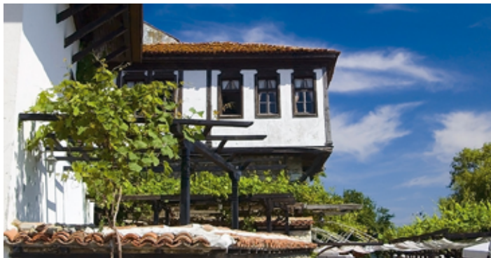
▲ Tradycyjna zabudowa Nesebyru