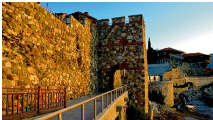
▲ Fragment fortyfikacji w Sozopolu