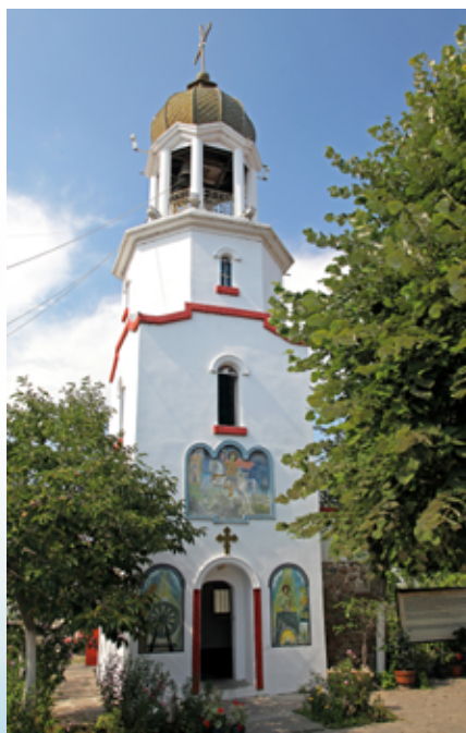
▲ Klasztor św. Jerzego

Dziś miejsce służy relaksowi, jednak trzeba pamiętać, że 2,5 tys. lat dziejów miasteczka (do 1934 r. nazywanego Anchiło, Анхило) nie przebiegało spokojnie. Była tu grecka kolonia, rzymskie civitas magna