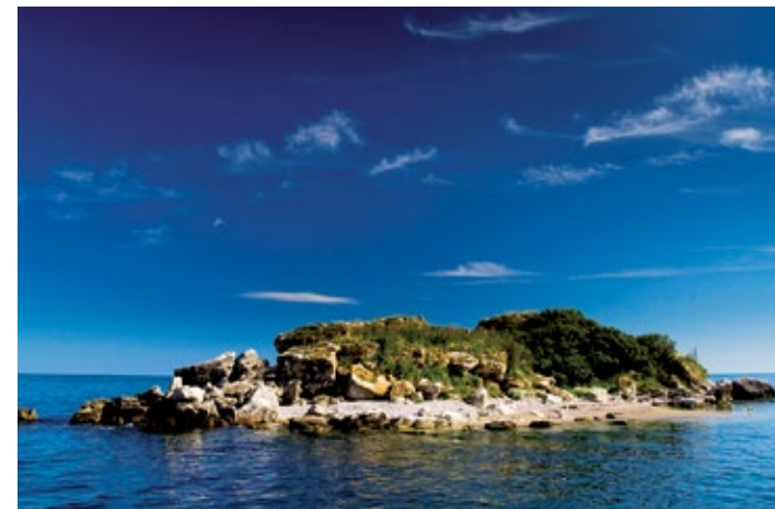
▲ Wybrzeże w okolicach Rusałki

Obfitość mniejszych i większych zatoczek nie pozostawia zbyt wiele miejsca dla piasku. Mimo to ustronne, romantyczne i płytkie zatoki doceniane są przez zwolenników słońca i morza. Gdziekolwiek z wody wystają skały, na które podpłynąć mogą amatorzy dyskretniejszego opalania. Wedle legendy miłośnikami tego miejsca byli również piraci ukrywający w skalnych zatoczkach swe skarby. Dziś skarbem jest możliwość aktywnego wypoczynku: żeglarstwo, nurkowanie, tenis, łucznictwo, kąpiele wodne (lecznicze natryski wodą mineralną – o temperaturze 38°C – znajdując się w miejscu rzymskich term) i borowinowe, oraz oferta rozrywkowa, z której słynie Club Med.