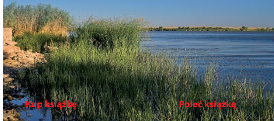
▼ Nad jeziorem Durankuła

Z kempingu dojdziemy do wrzynającego się w morze cypla Kartalburun (co po turku oznacza ponoć „orli przylądek”), gdzie mieści się mała przystań rybacka. Na północ i na południe rozciągają się długie, kilkukilometrowe plaże. Niestety, zaplecze turystyczne jest tu bardzo ubogie, a chętnych do skorzystania z kąpiele nie ma zbyt wielu. Są jednak ludzie, dla których te właśnie cechy będą atutem: zwykle jest tu cicho, spokojnie i... właśnie pustawo. Z drugiej jednak strony „dzikość” plaży nie sprzyja czystości – w niektórych miejscach jest brudno i przeszkadzać mogą wodorosty zanieczyszczające plażę oraz wydzielające nieprzyjemny zapach.