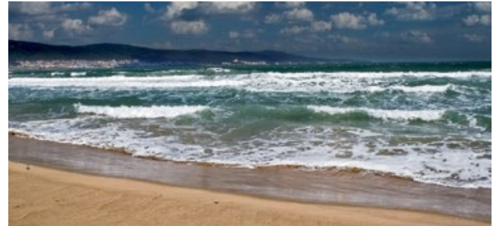
▲ Czarnomorska plaża

260 gatunków zwierząt i roślin, z których wiele jest gatunkami rzadkimi albo wręcz zagrożonymi. Gniazduje tu wiele gatunków ptaków, m.in. bączek ( Ixobrychus minutus ), podgorzałka ( Aythya nyroca ), trzcinniczek kaspijski ( Acrocephalus agricola ), kormoran mały ( Phalacrocorax pygmeus ) oraz pelikan różowy ( Pelecanus onocrotalus ). W jeziorze żyje natomiast sazan , dzika odmiana karpia.