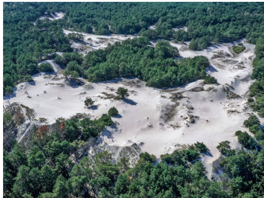
▲ Rezerwat przyrody Mierzeja Sarbska

Wakacyjne życie miejscowości koncentruje się na deptaku Tadeusza Kościuszki, która jest główną ulicą Łeby. Spod licznych reklam i szyldów wyłania się tu dawna ceglana zabudowa. Popularne są również ulice Wojska Polskiego i Nadmorska w części miasta położonej bliżej plaży. Znajdziemy tam kawiarnie, restauracje i infrastrukturę rozrywkową. Przy plaży wschodniej, nad samym brzegiem morza, stoi zabytkowy hotel Zamek Łeba , który dekoracyjną architekturą przypomina nieco średniowieczną warownię. To bez wątpienia najciekawsza budowla Łeby.