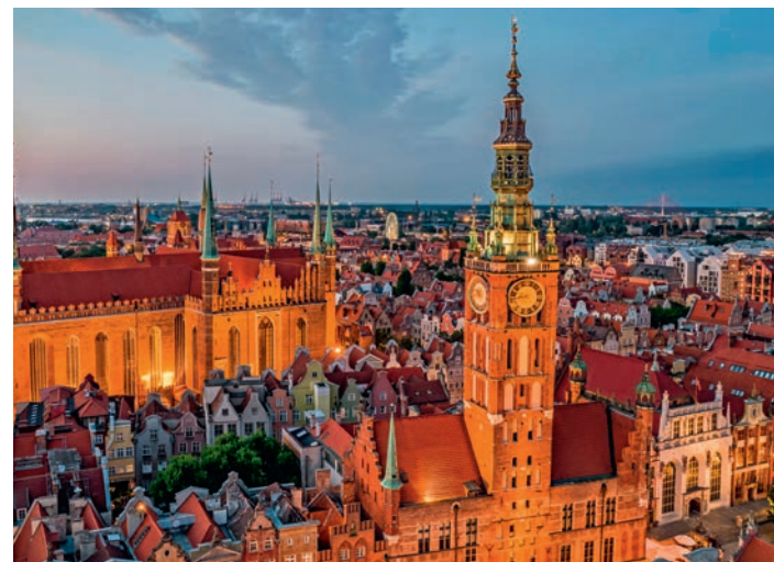
▲ Ratusz Głównego Miasta w Gdańsku

Gmach ten znajduje się na rynku zacisznego i przepięknego miasteczka. Budynek o konstrukcji ryglowej (inaczej: mur pruski) pochodzi z 1697 r.