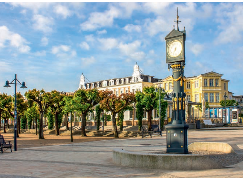
▲ Centrum Ahlbecku

W okolicy. Zanim jednak założona w XVII w. miejscowość (obecnie dzielnica Heringsdorfu) stała się uznanym kurortem, była tradycyjną wioską rybacką. Duży napływ nowych mieszkańców nastąpił w połowie XVIII w., a już w połowie następnego stulecia pojawili się pierwsi letnicy. Na przełomie XIX i XX w. nastąpiła intensywne rozbudowa miasta. Powstało wówczas wiele pięknych willi, pensjonatów i hoteli. Wszystkie są sztywne, raczej eklektyczne, inspirowane różnymi stylami i regionami, reprezentują tzw. architekturę nadmorską, znaną też jako kajzerowska (niem. kaiser – cesarz). Nic w tym dziwnego, w końcu spacerom nad brzegiem Bałtyku oddawali się tu cesarze niemieccy, m.in. Wilhelm I, Fryderyk III i Wilhelm II, a także cesarz Austro-Węgier Franciszek Józef I.