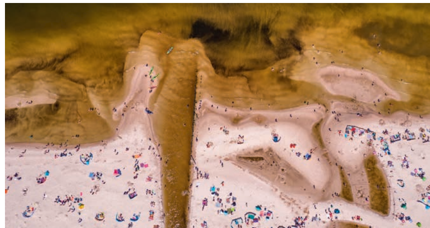
▲ Ujście Piaśnicy na plaży w Dębkach

Po wejściu na plażę należy skręcić w lewo i iść wzdłuż brzegu przez ok. 1 km, a następnie zejść z plaży, idąc w głąb lądu. Po kilkuset metrach mija się pierwszą wiatę odпочynkową, a niedługo później drogą. Po prawej widać czoło ruchomej wydmy Stilo , będącej przykładem wydmy para-