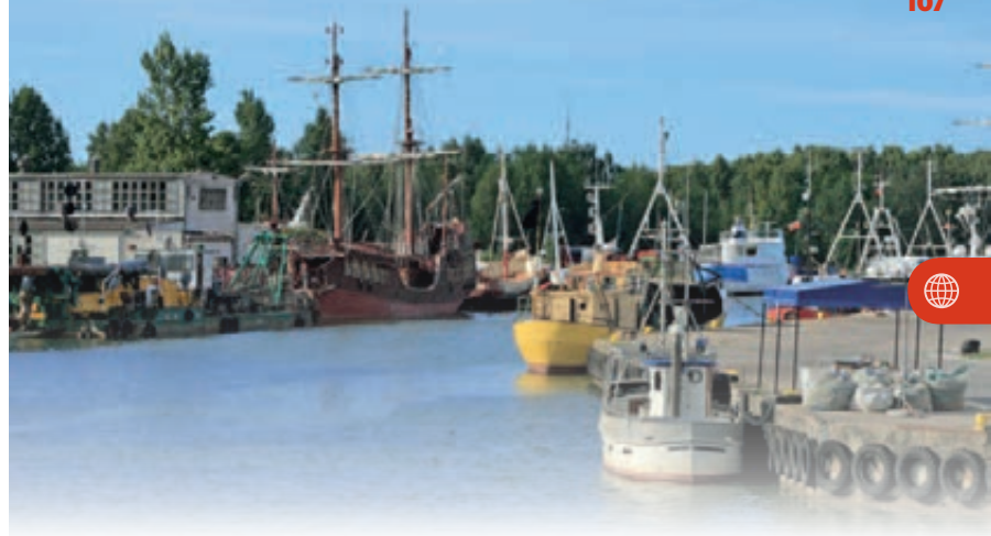
▲ Port jachtowy w Łebie