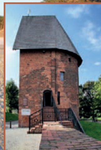
▲ Baszta czarownic