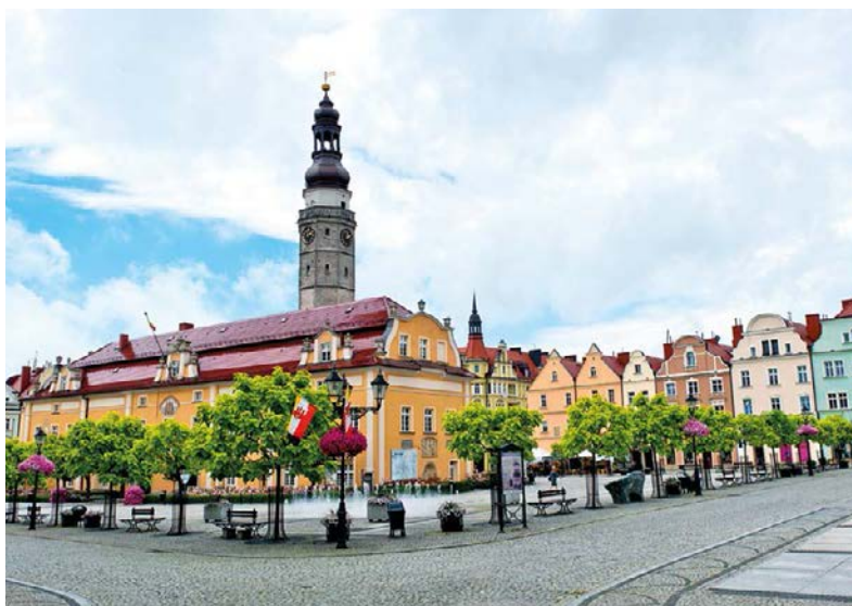
↗ Rynek w Bolesławcu

Rozległy rynek powstał na przecięciu szlaków handlowych z Pragi na północ i z Niemiec do Rusi. Niegdyś odbywał się na nim handel, dziś jest on przede wszystkim miejscem spotkań. Sprzyjają temu ładna, niedawno odnowiona zabudowa oraz liczne kawiarnie i restauracje. Rynek jest bardzo zadbane i tętni życiem, co jest rzadkością w dolnośląskich miastach. Najpiękniejszą budowlą na rynku jest ratusz , wzniesiony w 1. poł. XVI w. na miejscu wcześniejszej siedziby rajców, a w XVIII w. przebudowany w stylu barokowym. Zachowano jednak gotycką wieżę i nieco elementów wystroju wnętrza.