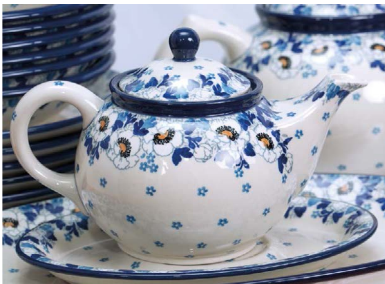
▲ Porcelana bolesławiecka

Wspaniałe wyroby, z których słynie Bolesławiec, możemy zobaczyć w Muzeum Ceramiki (dojście ul. Sierpnia 80, a potem skręt w ul. Mickiewicza). Obejrzeć tu można przedmioty produkowane przed 1945 r., a także stworzone w miejscowych zakładach po II wojnie światowej. Placówka ma jeszcze filię – Dział Historii Miasta przy ul. Kutuzowa 14, gdzie prezentowane są najważniejsze wydarzenia z dziejów Bolesławca, a także doskonała ceramika artystyczna. Duże wrażenie robi odtworzona XVI-wieczna apteka, z fiolkami i pięknymi stojami w stylowej gablocie.