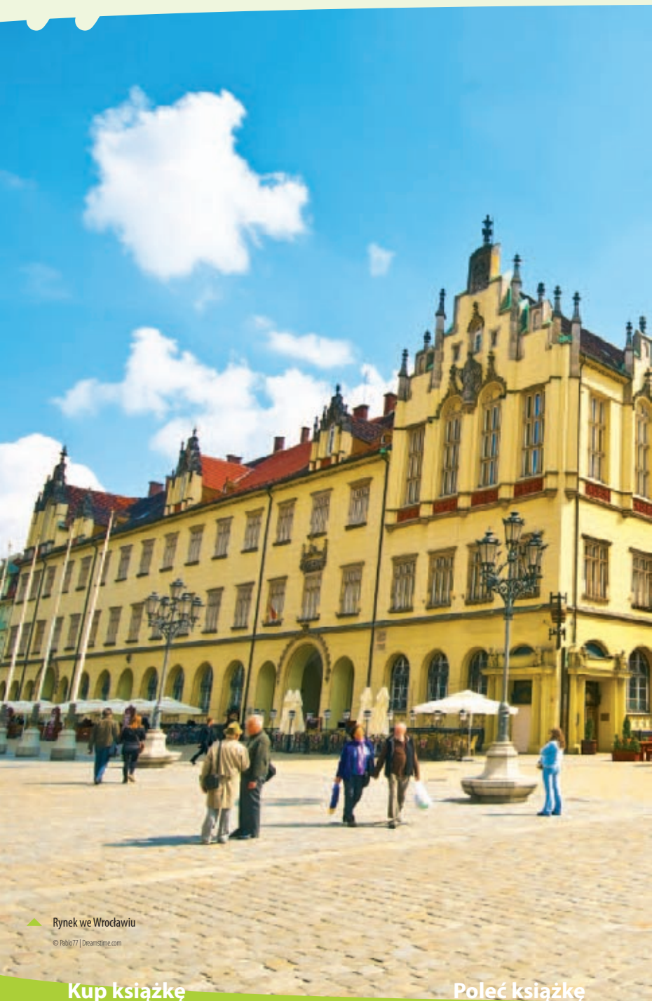
Rynek we Wrocławiu