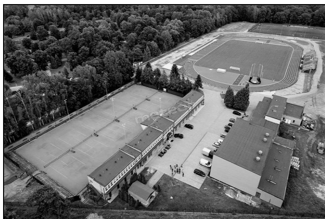
Fot. 1. Stadion ULKS MOSiR Sieradz

Najbardziej ubogim zagospodarowaniem sportowym w 2016 r. charakteryzował się stadion w Tomaszowie Mazowieckim. Znajdowało się w nim jedno boisko do gry, które miało sztuczną nawierzchnię, dzięki czemu treningi mogły być prowadzone zarówno latem, jak i wtedy, kiedy na płycie boiska leżał śnieg. Zdecydowanie najlepszą infrastrukturę piłkarską posiadał SMS Łódź. Tutaj piłkarki w jednym miejscu miały zarówno bazę treningową, jak i szkołę oraz odnowę biologiczną, lekarza i salę do rehabilitacji. Najbogatszą infrastrukturą sportową wyróżniał się natomiast MOSiR, mieszczący się w Sieradzu (fot. 1), z którego boisk piłkarki korzystały dwa razy w tygodniu, jako że nie posiadały własnego stadionu. W obiekcie jednocześnie mogło odbywać się wiele imprez sportowych i wydarzeń dla rodzin z dziećmi.