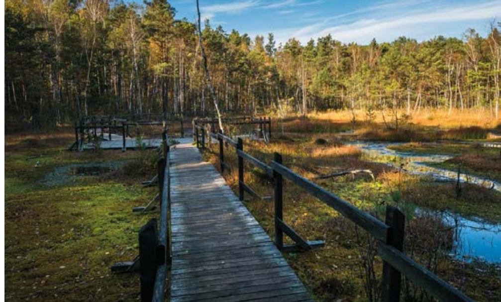
▲ Goździkowe Bagno

Trasa prowadzi leśnym traktem (uwaga – miejscami piaszczyste podłoże może utrudniać jazdę) aż do skansenu militarnego na Dąbrowieckiej Górze. Dwa schrony typu Regelbau 120a i Regelbau 514 zostały wzniesione przez hitlerowców w latach 1940–41 i stanowiły fragment umocnień Przedmościa Warszawy (Brückenkopf Warschau). Zwykle można je oglądać tylko z zewnątrz, ale wnętrza bywają udostępniane przez Stowarzyszenie „Pro Fortali-