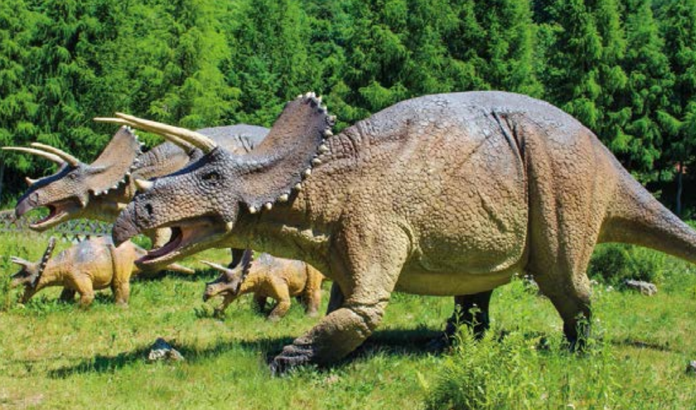
↗ JuraPark w Bałtowie