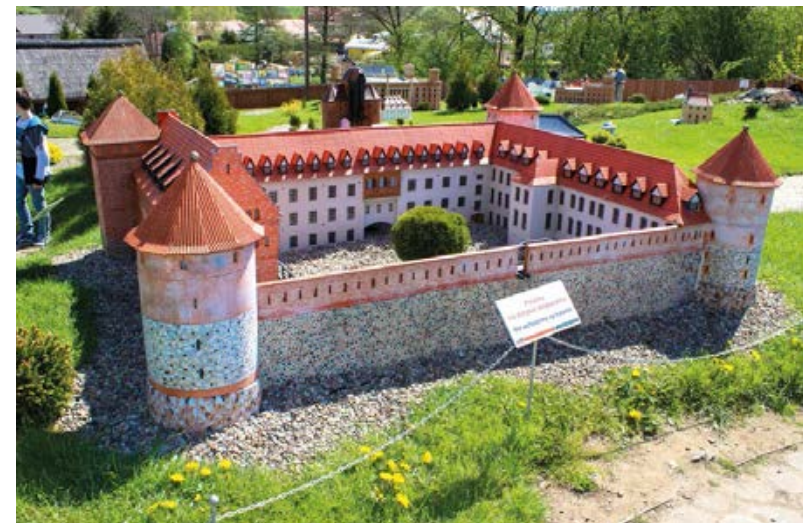
↗ Park Miniatur w Bałtowie

Atrakcją, którą dzieci muszą koniecznie zobaczyć, jest Bałtowski Zwierzyńiec . Dolna część ogrodu to minizoo, w którym spotkamy łagodne osiołki, owce, kozy, muflony, surykatki, szopy pracze czy jenoty, a także ptaki: papugi, żurawie, gołębie ozdobne oraz pawie i bażanty.