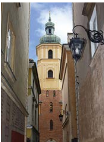
▲ Kościół św. Marcina przy ul. Piwnej

Znajduje się dosłownie tuż obok archikatedry i pozostaje nieco w jej cieniu, choć sama budowla kościoła jest nieznacznie wyższa (ma najwyższą wieżę w Starym Mieście). Jednym z inicjatorów budowy tej późnorennesansowej świątyni, stopniowo powiększanej, z okazałą kopułą i smukłą wieżą, był Piotr Skarga, a fundatorem m.in. Zygmunt III Waza. Budynek klasztorny wznosi się w miejscu dawnej kamienicy mieszczańskiej zakupionej na potrzeby konwentu. Sanktuarium także wiele przeszło: wnętrza świątyni zostały ograbione przez Szwedów w czasie ich najazdu, po kasacie zakonu zmieniali się właściciele, wśród których był również zakon pijarów, a podczas powstania warszawskiego całość zespołu klasztorowego uległa zniszczeniu. W 1948 r. jezuita (którym zwrócono obiekt jeszcze przed II wojną światową) przystąpili do trwającej niespełna 10 lat odbudowy. Kościół kryje gotyckie podziemia będące pozostałością zniszczonych w 1607 r. pożarem kamienic mieszczańskich. Znajdziemy w nim renesansowy krucyfiks pochodzący z Lubeki , nagrobek wojewody lubelskiego Jana Tarły (przeniesiony z kościoła Pijarów), zabitego w 1750 r. w pojedynku z Kazimierzem Poniatowski, barokową rzeźbę Matki Bożej Łaskawej znajdującą się w zakrystii oraz – a może przede wszystkim – umieszczony w głównym ołtarzu, słynący łaskami obraz Matki Boskiej Łaskawej z pierwszej połowy XVII w. , подарowany królowi