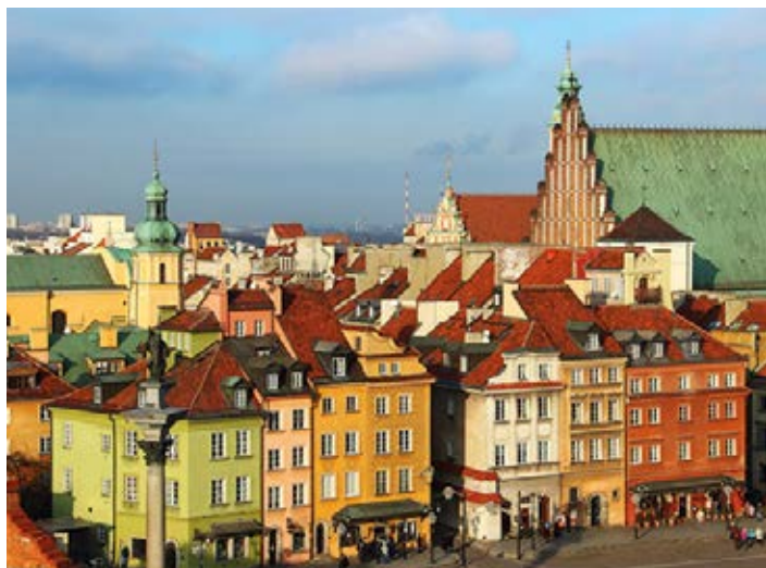
▲ Kamienice przy placu Zamkowym

rezydencji, lecz także nowoczesnymi rozwiązaniami, jak np. ogród na dachu Biblioteki Uniwersyteckiej. Śródmieście jest obrazem przeszłości stolicy – Stare i Nowe Miasto, doszczętnie zrujnowane i potem odbudowane, wpisane jest na Listę światowego dziedzictwa kulturowego i przyrodniczego UNESCO jako przykład wiernej rekonstrukcji; pagórkowaty Muranów, zawdzięczający nazwę Bellottiemu (nadwornemu architektowi królów Michała Korybuta Wiśniowieckiego i Jana III Sobieskiego) pochodzącemu z wyspy Murano, posadowiony jest bezpośrednio na gruzach getta; Mariensztat, zamysłem odnoszący się do małych polskich XVIII-wiecznych miasteczek, powstał w rekordowym czasie jako pierwsze osiedle mieszkaniowe po wojnie; Marszałkowska Dzielnica Mieszkaniowa jest