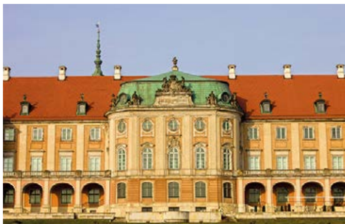
▲ Zamek Królewski – fasada saska

Rozkwit kultury dworskiej został przerwany przez najazd Szwedów i wojsk brandenburskich w 1655 r. Zamek zniszczono i ograbiono – wywieziono bezcenne obrazy, meble, gobeliny, królewską bibliotekę i archiwum koronne, a także liczne rzeźby, elementy architektoniczne oraz chorągwie królewskie. Wnętrza zostały zdemolowane. W 1657 r. z inicjatywy króla Jana Kazimierza rozpoczęto