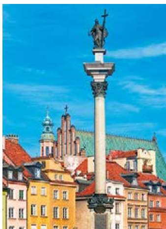
▲ Kolumna Zygmunta III Wazy

📍 Zamek Królewski , pl. Zamkowy 4. Dojazd: autobus – 116, 128, 175, 178, 180, 222, 503, 518, N44 przystanek „Plac Zamkowy”; autobus – 118, 185 przystanek „Podzamcze”; autobus – 160, 190, 226, 527, N11, N16, N21, N61, N66, N71 przystanek „Stare Miasto”; tramwaj – 4, 13, 20, 23, 26, T przystanek „Stare Miasto”; tel.: 22 3555170;