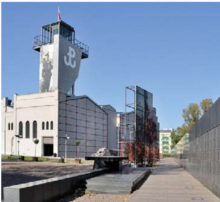
▲ Muzeum Powstania Warszawskiego

i życia codziennego ówczesnej warszawskiej ulicy. Dla dzieci przeznaczona jest Sala Małego Powstańca , gdzie mogą wysłuchać powstańczych piosenek, obejrzeć teatrzyk lub wcielić się w role harcerskich listonoszy czy sanitariuszek.