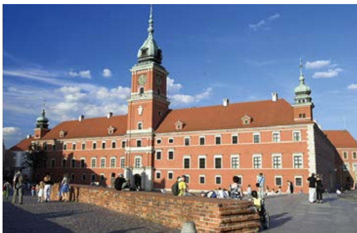
▲ Zamek Królewski

3 maja 1791 r. Sejm Czteroletni uchwalił na zamku konstytucję – pierwszą w Europie i drugą na świecie. Upadek