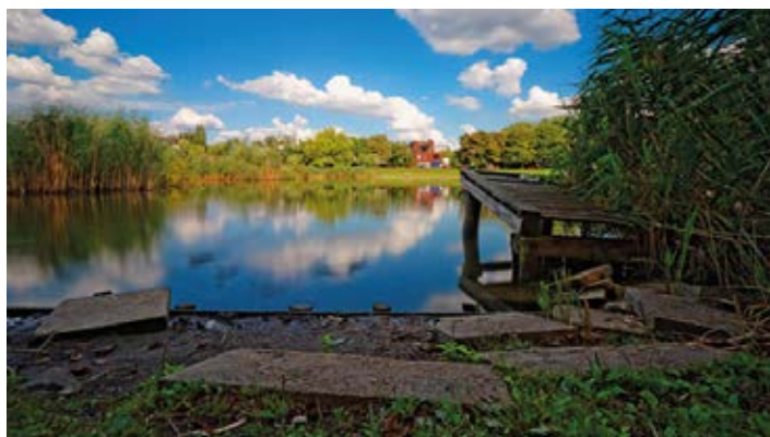
▲ W parku Szczęśliwickim

Biblioteka Narodowa , al. Niepodległości 213; dojazd: autobus – 167, 174, 700, N34, N36 przystanek „Biblioteka Narodowa”, tramwaj – 17, 33 przystanek „Biblioteka Narodowa”; tel.: 22 6082999, www.bn.org.pl ; otwarte: najpopularniejsze czytelnie oraz Informatorium pn.–sb. 8.30–20.30.