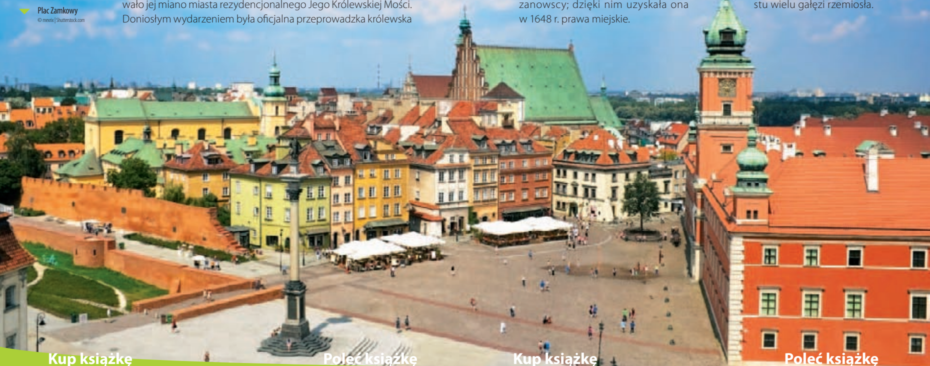
Plac Zamkowy

Szczególny pierścień tworzyły wznoszone wokół Starego i Nowego Miasta prywatne miasteczka magnackie zwane jurydykami . Lokowane na gruntach podmiejskich, na prawach chełmińskim i magdeburskim, wydzielone były spod działania sądownictwa i administracji miejskiej oraz zwolnione z opłat na rzecz stolicy. Posiadały własne prawa, zwyczajne, straże, ratusze, a nawet herby. Stanowiły poważną konkurencję gospodarczą, wprowadzając podział na Warszawę magnacką i mieszczańską. Rozbiły strukturę organizmu miejskiego, utrudniając jego regularny rozwój terytorialny oraz gospodarczy. Powodowały trudności w administrowaniu, uniemożliwiając np. rozplanowanie układu dróg. Z drugiej strony przyczyniły się do rozwoju terytorialnego miasta oraz wzrostu wielu gałęzi rzemiosła.