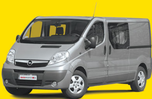
Opel Vivaro L2H1 2.0 115KM 2010

103 100 zł 74 000 zł cena autosalon24 rabat 28%