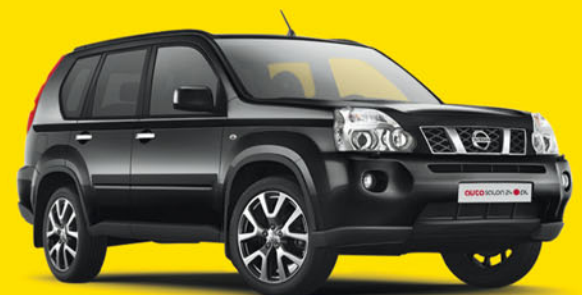
Nissan X-trail LE 2.0 173KM 2011

63 400 zł 48 500 zł cena autosalon24 rabat 24%