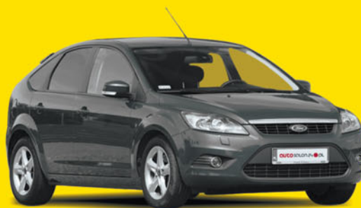
Ford Focus Amber X 1.6 100KM 2010

103 100 zł 74 000 zł cena autosalon24 rabat 28%