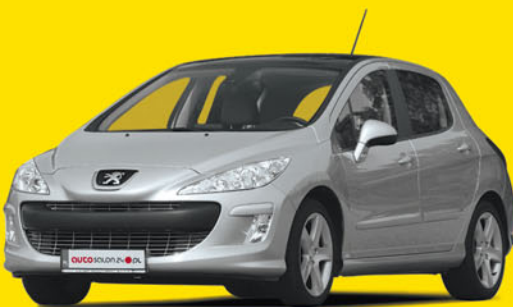
Peugeot 308 1.6 HDI 92KM 2010

151 200 zł 131 500 zł cena autosalon24 rabat 13%