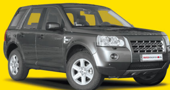
Land Rover Freelander 2.2d 150KM S-design 2011

72 800 zł 57 700 zł cena autosalon24 rabat 21%