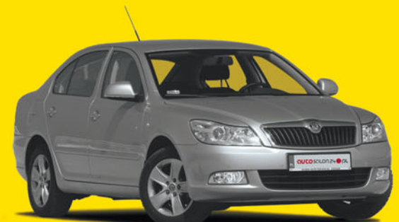
Skoda Octavia Mint Liftback 1.2 TSI 105 KM 2011

170 000 zł 137 700 zł cena autosalon24 rabat 19%