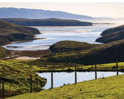
Point Reyes National Seashore