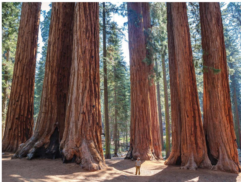
Park Narodowy Sekwoi

Warto wiedzieć: w zależności od preferencji i kondycji fizycznej stawiamy na wędrówki po parkach i korzystamy z różnych ofert przygotowanych przez poszczególne miasta. Podróżując z dziećmi, wybierzmy się do Disneyland Resort w okolicach Los Angeles.