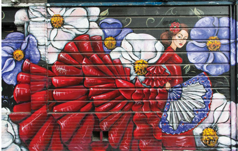
Mural w Mission District