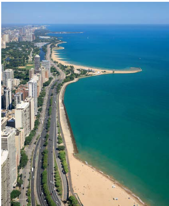
Widok na Chicago i jezioro Michigan