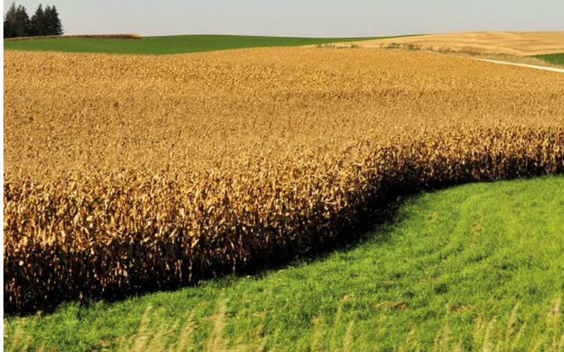
Pola kukurydzy

rolniczymi i wielkimi ośrodkami przemysłowymi, takimi jak Chicago, Detroit czy Minneapolis. Bezkrzesne pola uprawne między korytami rzek Ohio i Missouri graniczą z obszarem, który można określić mianem pasa mlecznego , rozciągającego się wzdłuż Wielkich Jezior, od Wisconsin (największy wytwórca sera w kraju i drugi pod względem produkcji mleka) po Nową Anglię. Region pełni też funkcję ważnego ośrodka hodowli bydła, choć ubojnie, z których słynęło m.in. Chicago, przeniesiono już gdzie indziej. W Minnesocie prym wiódł niegdyś przemysł (na początku XX w. miasto dzierżyło palmę pierwszeństwa w dziedzinie produkcji mąki), jednak obecnie stawia na rozwój najnowszych technologii i sektora usług (medycyna, handel), choć wciąż pozostaje kluczowym producentem kukurydzy i soi. W Regionie Wielkich Jezior, żyznym i bogatym w zasoby naturalne, rozwinęła się działalność handlowa, rolnicza i przemysłowa dzięki szlakom żeglugi rzecznej. Chicago jest jednym z najważniejszych ośrodków handlu zbożem na świecie (prężnie działająca branża rolno-spożywcza) i drugim pod