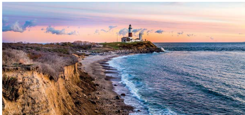
Widok na Atlantyk na jednej z plaż Long Island

♥ Podróż w czasie – odkrywanie codziennego życia XIX-wiecznych mieszkańców amerykańskich wsi w Genesee Country Village and Museum niedaleko Rochester. Możliwość spędzenia nocy... bez prądu i bieżącej wody. Dla amatorów przygód Zob. s. 141.