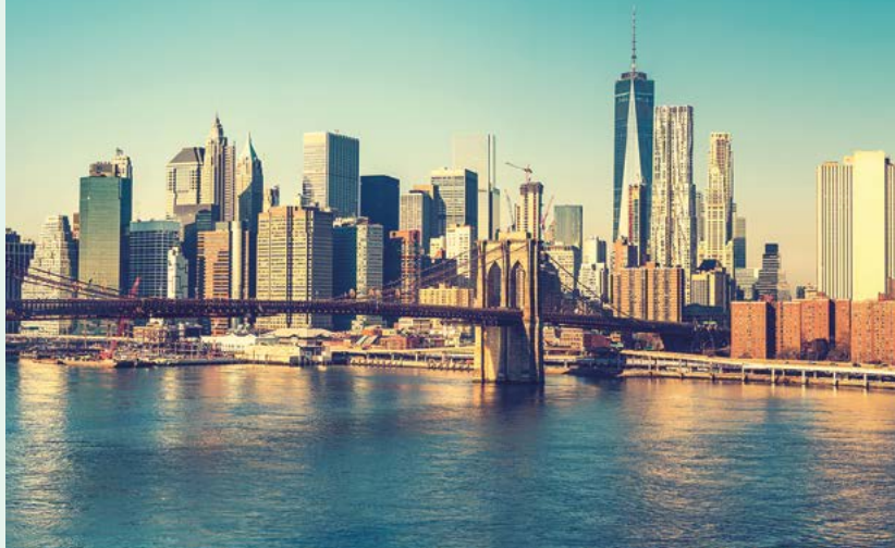
Most Brookliński i Manhattan