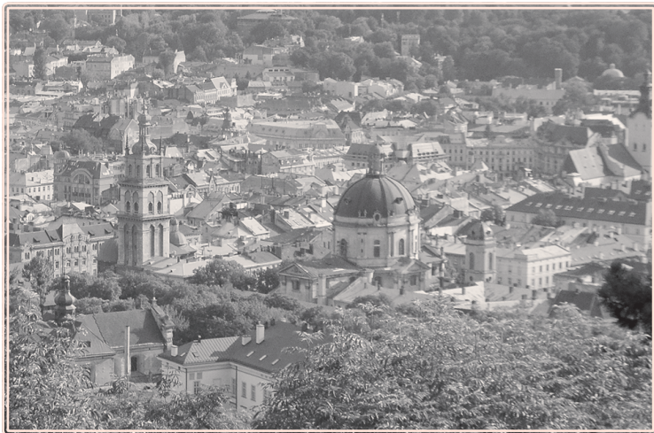
Lwów, panorama z kopca Unii Lubelskiej

latarnię uliczną, we Lwowie otwarto dużą elektrownię miejską (1900). Nawiasem mówiąc, wynalazca lampy naftowej i prekursor przemysłu naftowego, Ignacy Łukasiewicz, ściśle związany był z tym miastem – tu pracował jako aptekarz.