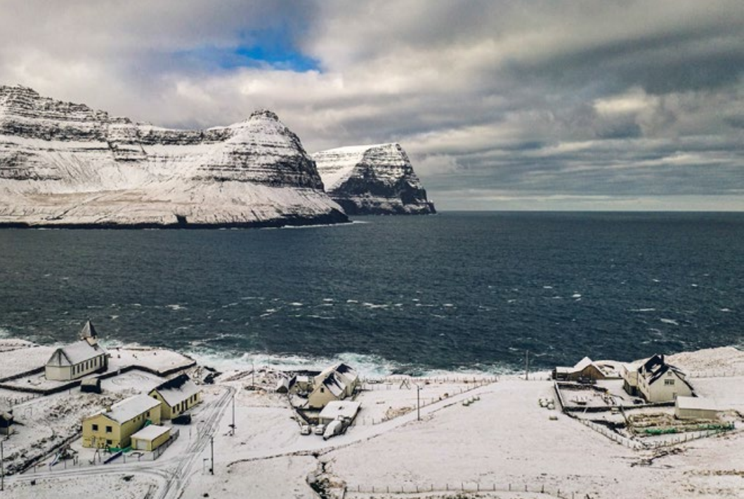
Zachodni kraniec wsi Viðareidri

Farerzy zaczęli robić zapasy. Ze sklepowych półek zniknęły mięso i papier toaletowy. W internecie pojawiało się coraz więcej dyskusji o tym, czy archipelag będzie bezpieczną oazą, czy pułapką, bo przecież jest tak silnie zależny od dostaw z Danii. Wyliczono, że przy odcięciu dostaw ropy po około trzydziestu dniach gospodarka by się załamała.