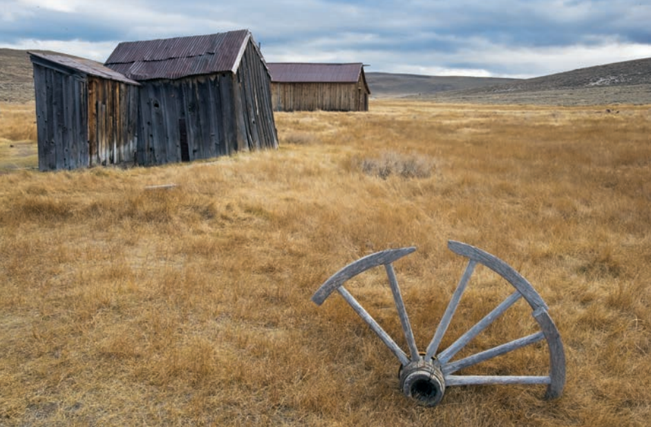
PO LEWEJ U GÓRY: BODIE, PARK STANOWY W KALIFORNII. Urzekło mnie koło częściowo zakopane w ziemi i chciałam je pokazać na tle wymarłego miasteczka. Poprzez relację między kołem a budynkami ukazana została pustka i ogrom przestrzeni. Obiektyw 24 – 105 mm, ogniskowa 31 mm, f/16, 1/6 s