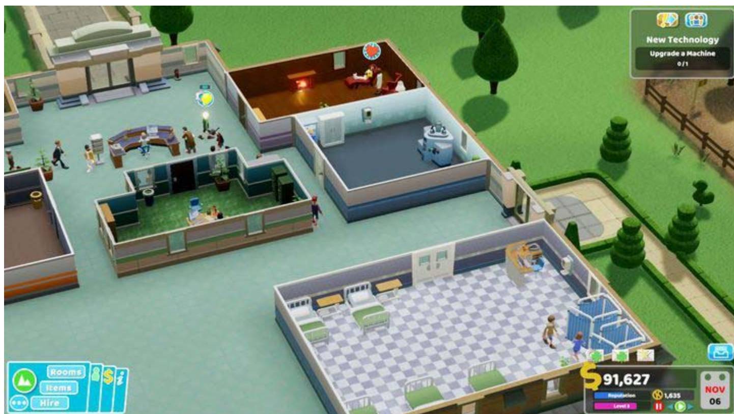
Typowy początek w Lower Bullocks.

W Lower Bullocks dominują pacjenci o chorobach psychiatrycznych. Jednak nie są oni jedynymi pacjentami, którzy będą pojawiać się dość często.