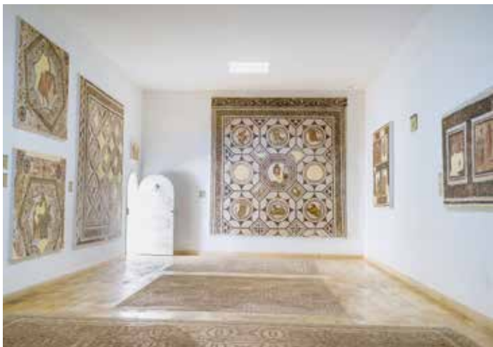
▲ Muzeum Archeologiczne