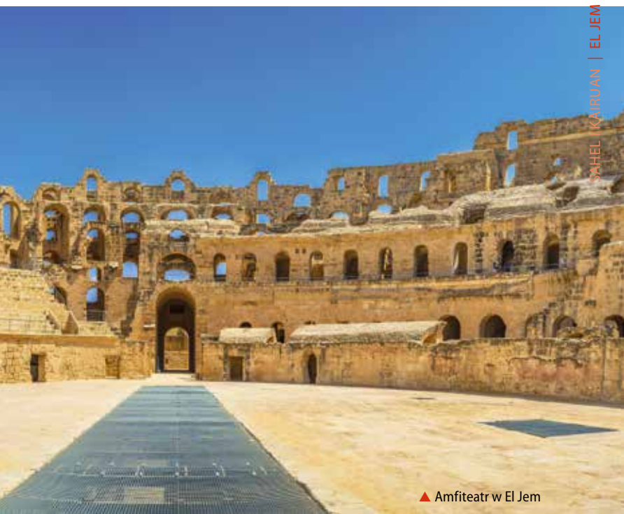
▲ Amfiteatr w El Jem