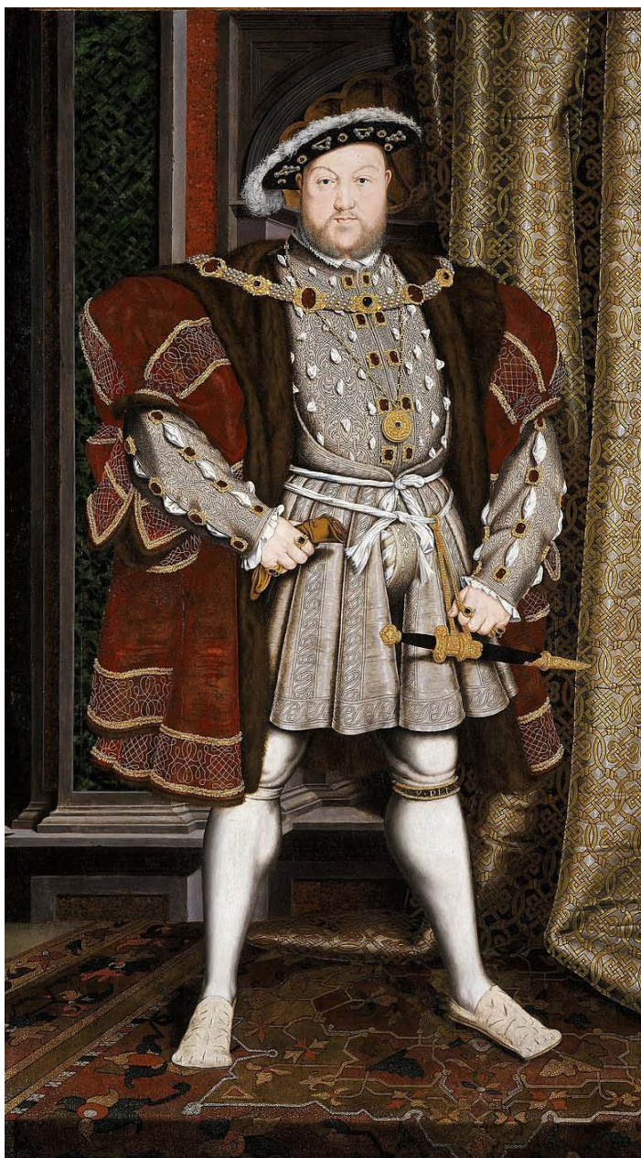
Henryk VIII na obrazie Hansa Holbeina