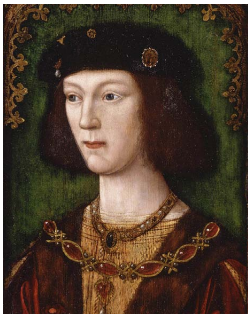
Osiemnastoletni Henryk VIII po koronacji w 1509 r.

Cechami, jakimi odznaczał się kardynał Wolsey były pycha, zawiść i małostkowość. Jednocześnie był to człowiek dużego formatu intelektualnego, niezrównany dyplomata i zdolny administrator. Podobnie jak znaczna część duchowieństwa tamtych czasów, bardziej upodobał sobie doczesne zajęcia i rozkosze. Zaniedbywał wiele z pełnionych przez siebie urzędów kościelnych i w ogóle rzadko zdarzało mu się odprawiać mszę. Lekce sobie ważył śluby czystości – z partnerką życiową, z którą mieszkał, doczekał się dwójki dzieci – syna, dla którego wystarał się o liczne godności kościelne i córkę, która została zakonnicą. Ambicją Wolseya było wzmocnienie wpływu Anglii na politykę europejską i aktywny udział w dynamicznej rozgrywce politycznej z Francją i Hiszpanią. W polityce wewnętrznej lubił utrzcęć nosa wyższym i możniejszym warstwom społecznym, nieraz z korzyścią dla tych, którzy jak on sam pochodzili z gminu – dzięki Wolseyowi udawało się nieraz łagodzić skutki procesu groduzenia ziemi.