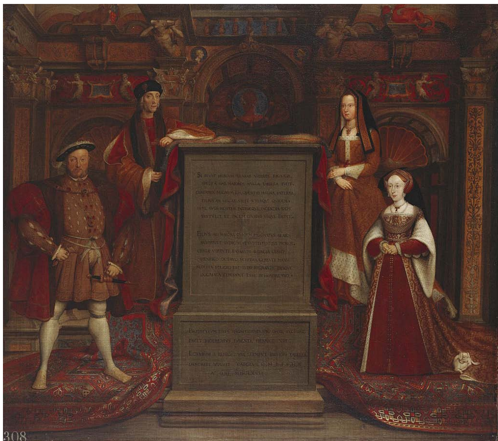
Henryk VII, Elżbieta z Yorku, Henryk VIII i Jane Seymour na obrazie Remigiusa van Leemputa z 1667 r.