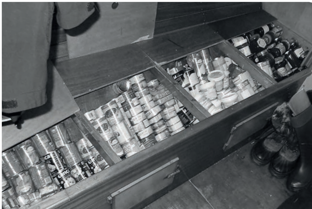
Przestrzeń pod dolną koją, jedna z wielu skrytek wykorzystywanych do magazynowania zapasów żywności. (A.H.)