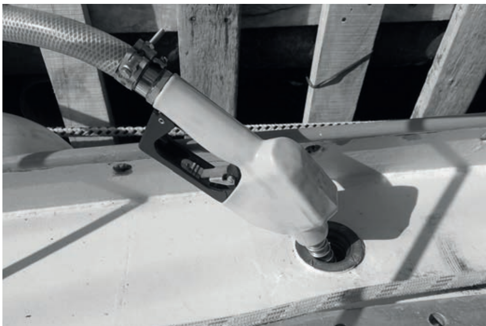
Port jachtowy w Ushuai, tankowanie paliwa. (A.H.)