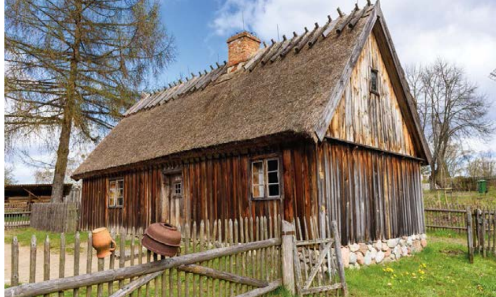
⤴ Chatupa zagrodnika z Borska w Kaszubskim Parku Etnograficznym