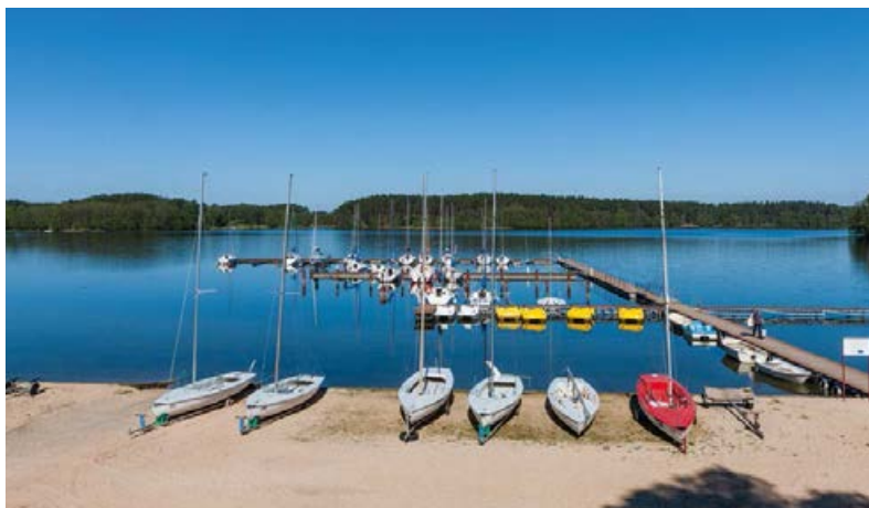
▲ Przystań w Borsku

Po krótkim odcinku asfaltowym znów odbijamy w szutrową drogę. Skręciwszy na południe, ponownie zbliżamy się do wysokiego brzegu jeziora, tym razem