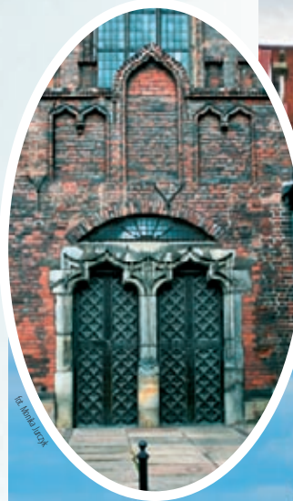
Bazylika Mariacka – gotycka wizytówka Gdańska