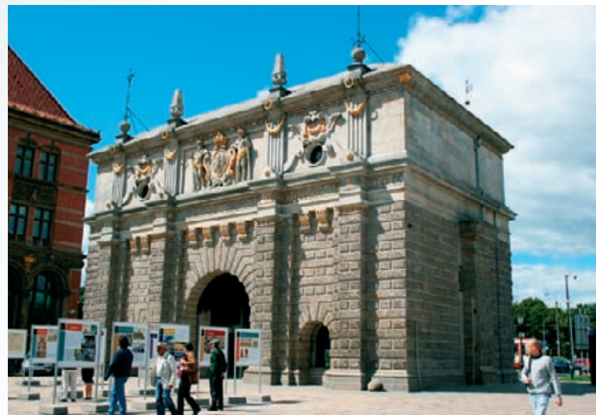
Brama Mariacka – jej funkcje obronne rzucają się w oczy