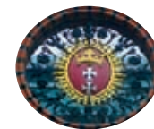
Herb Gdańska (budynek Hali Targowej)

Po porażce Krzyżaków pod Grunwaldem Gdańsk złożył przysięgę wierności Jagiellonom, w zamian za co uzyskał wiele przywilejów – m.in. prawo posiadania floty czy pozwolenie na bicie własnej monety. Przejął także dobra należące wcześniej do zakonu. Był to początek tzw. złotego okresu rozwoju Gdańska.