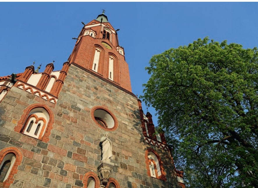
▲ Kościół św. Jerzego

Górze, dzięki czemu była widoczna z daleka. Dziś jest jednym z najbardziej charakterystycznych punktów przy ulicy Bohaterów Monte Cassino.