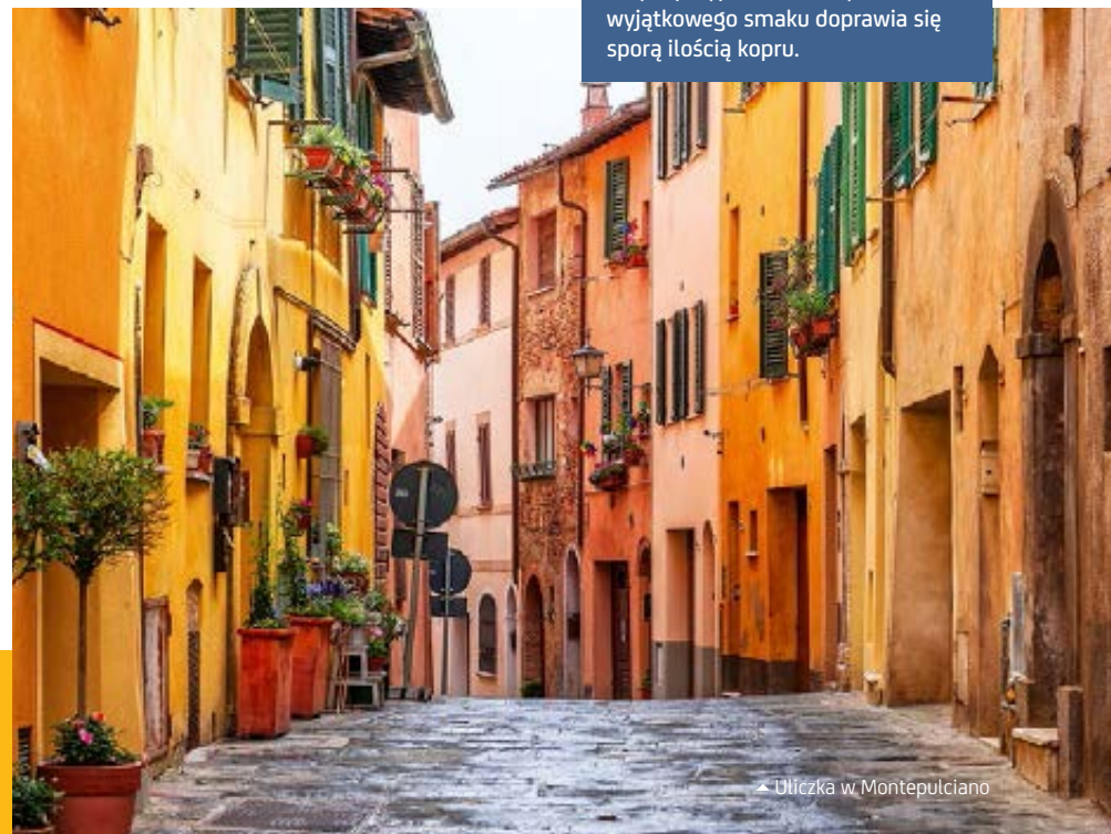
▲ Uliczka w Montepulciano

W CUGUSI , osadzie położonej niedaleko Montepulciano, można odwiedzić mleczarnię i serownię specjalizującą się w tym regionalnym produkcie. Poza degustacją można również podziwiać, a nawet pogłaskać sympatyczne owce, dzięki którym możemy cieszyć się tym znakomitym smakiem. Deskę serów warto wzbogacić o wędliny, w szczególności te długo dojrzewające jak Prosciutto toscano czy Finocchiona, czyli tradycyjne włoskie salami przygotowywane w różnych częściach z chudego mięsa z łopatki świnii i tłustego z boczku, które w tym przypadku dla uzyskania wyjątkowego smaku doprawia się sporą ilością kopru.