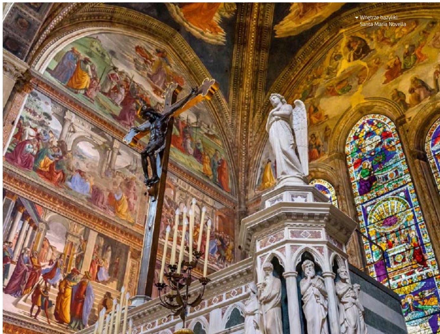
▼ Wnętrze bazyliki Santa Maria Novella