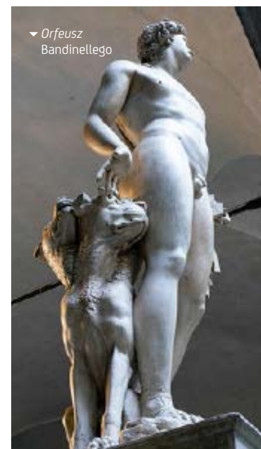
▼ Orfeusz Bandinello

Wnętrze ma rozbudowany schemat. Zaprojektowano je na planie krzyża tacińskiego – jego dłuższe ramię reprezentuje klasyczny układ bazylikowy: składa się z wyższej nawy głównej z drewnianym stropem kasetonowym i oknami wychodzącymi ponad dachy niższych naw bocznych, sklepionych żaglasto. Poprzecznie umieszczony jest transept, do którego przylegają zakrystie – tzw. Stara, dzieło Brunelleschiego, oraz Nowa, zaprojektowana przez Michała Anioła. Nad przecięciem nawy głównej i transeptu znajduje się czworoboczna kopuła. Nie ona jednak góruje nad świątynią – jej dominantą jest potężna kopuła kryjąca ośmioboczną kaplicę Medyceuszy (Cappella dei Principi; dosł. kaplica Książąt), wybudowaną na dłuższej osi bazyliki przez Buontalentię i Michała Anioła (wchodzi się do niej z tyłu świątyni). Wysokością przewyższa ona nawet przylegającą do Nowej Zakrystii smukłą wieżę dzwoniczną. Freski Rossa Fiorentina, rzeźby i płaskorzeźby Donatella i Michała Anioła to tylko niektóre arcydzieła znajdujące się w kościele.