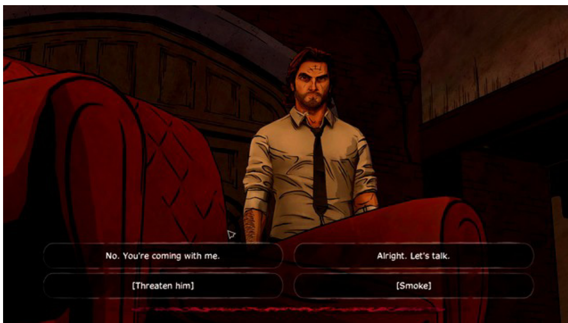
Ważny wybór 5

Ważny wybór 4: Czwartym ważnym wyborem jest decyzja o wysłaniu Mr.Toad'a wraz z juniozem na farmę. Wybór ten znajdziesz w piątym rozdziale. Skutków brak.