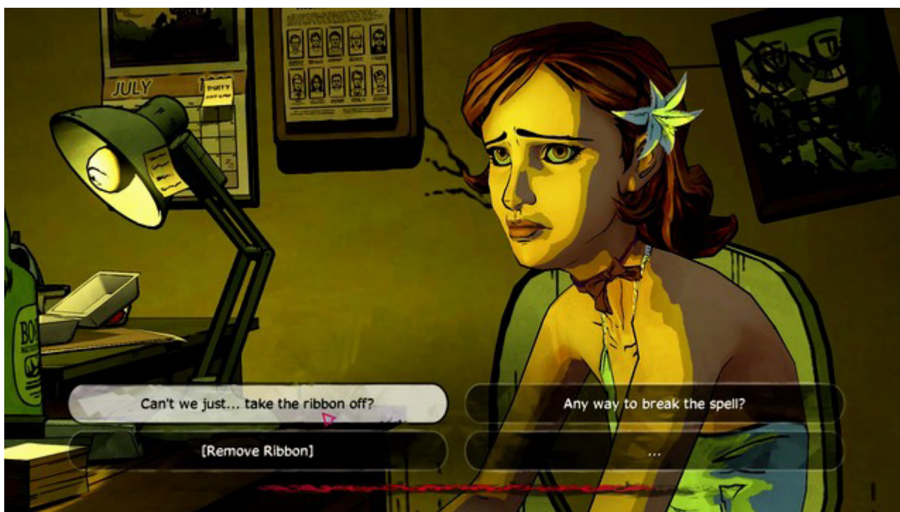
Ważny wybór 2

Ważny wybór 2: Drugim ważnym wyborem jest decyzja czy spróbujemy ściągnąć wstążkę Nerissy . Skutków brak. Wybór ten znajdziesz pod koniec pierwszego rozdziału gry.