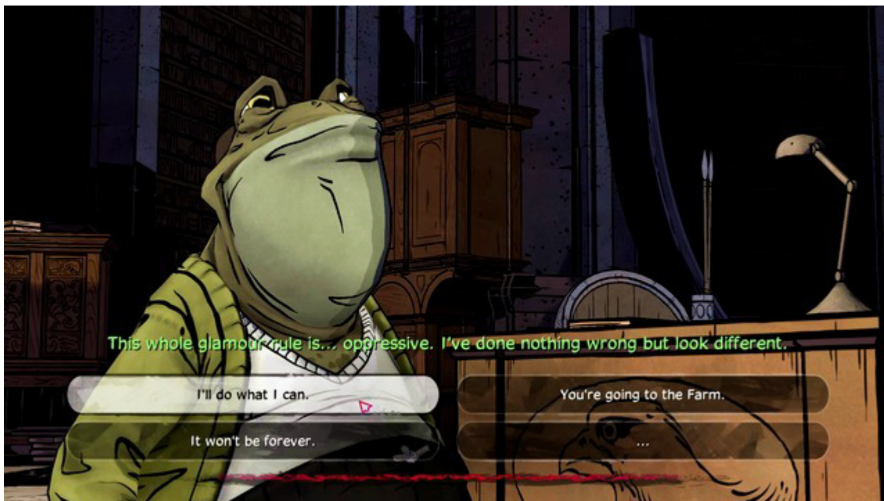
Ważny wybór 4

Skutki wyboru trzeciego są identyczne w obu przypadkach. Znajdziesz kawałek magicznego lustra po czym udasz się do Woodlands.