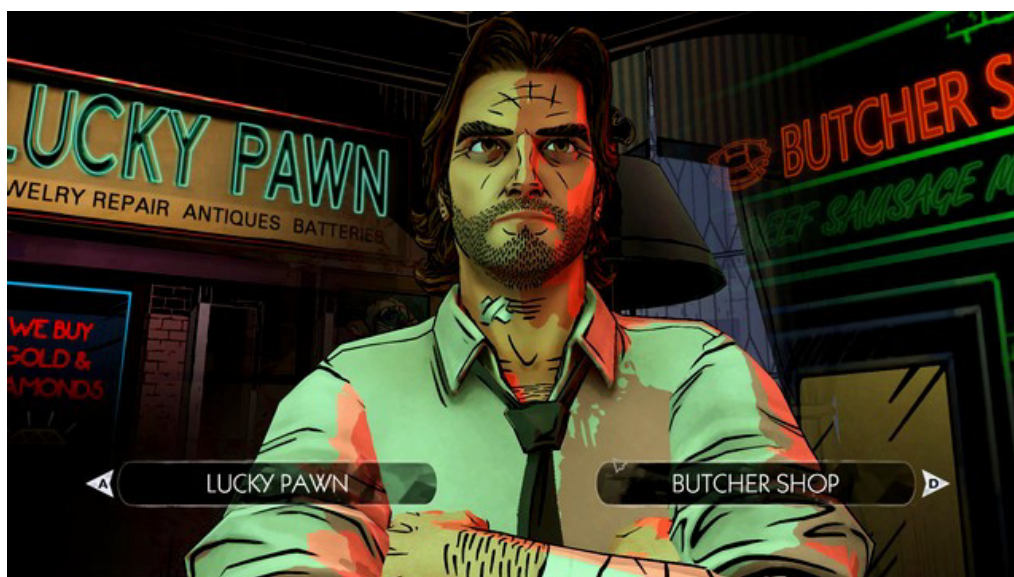
Ważny Wybór 3

Ważny wybór 2: Drugim ważnym wyborem jest decyzja czy spróbujemy ściągnąć wstążkę Nerissy . Skutków brak. Wybór ten znajdziesz pod koniec pierwszego rozdziału gry.