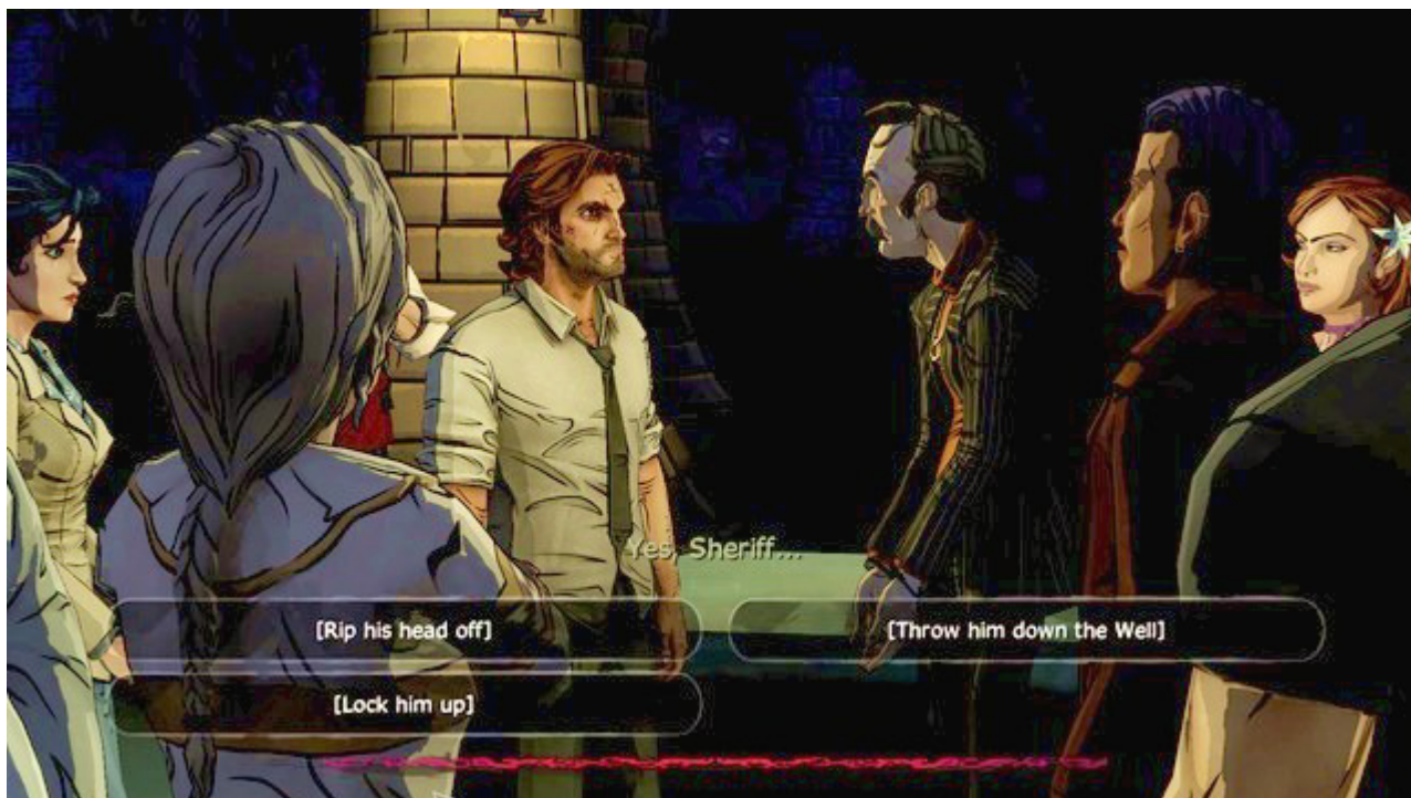
Ważny wybór 3

Trzecim ważnym wyborem jest decyzja o losie Crooked Man'a , która została wspomniana w drugim ważnym wyborze. Wybór ten znajdziesz w piątym rozdziale epizodu, On Fairness .