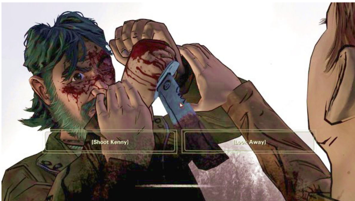
Ważny wybór 4

Czwarty ważny wybór zawarty jest w rozdziale dziewiątym. Twoją decyzją jest czy zastrzelisz Kenny'ego . Konsekwencje wyboru zawarte zostały w rozdziale Zakończenia