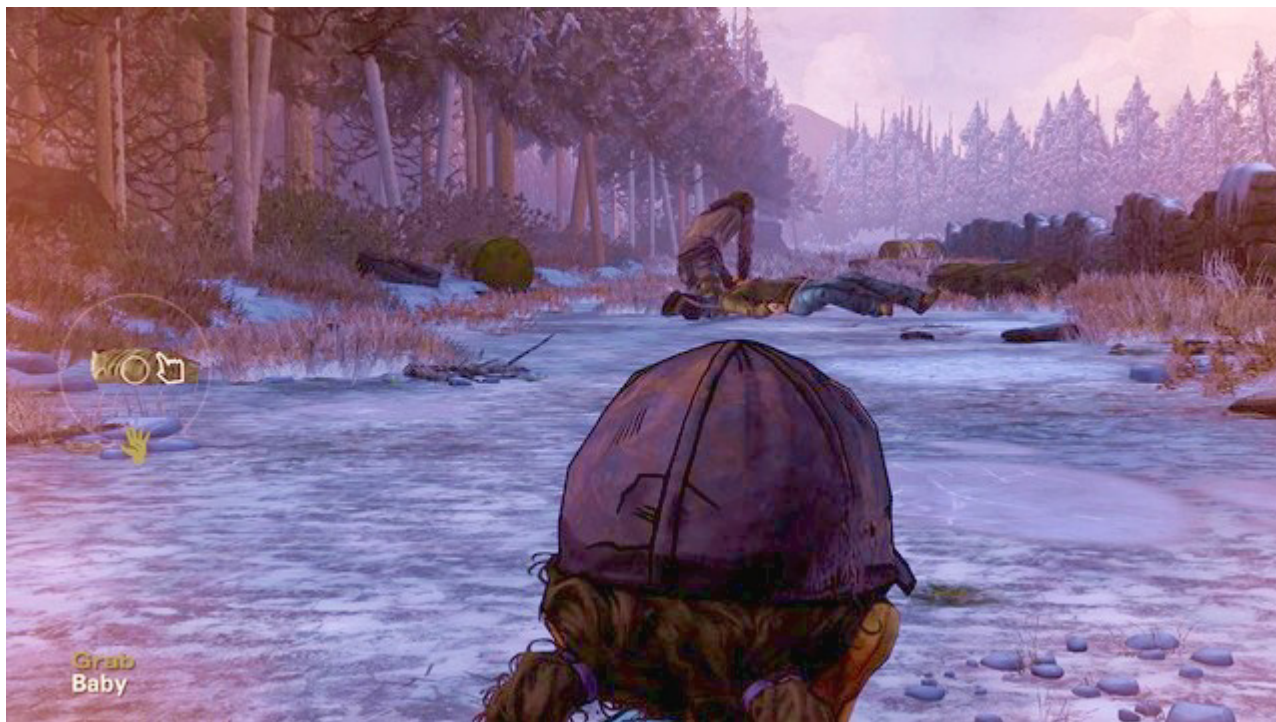
Ważny wybór 1

Pierwszym ważnym wyborem jest sytuacja przedstawiona w pierwszym rozdziale tego epizodu. Do ciebie należy decyzja czy chcesz uratować Alvina jr. czy zostawisz go i uciekniesz do kryjówki. Brak konsekwencji wyboru