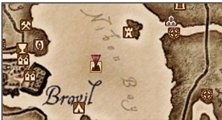
Czerwona strzałka wskazuje portal do krainy Sheogoratha.

Udaj się w miejsce zaznaczone na mapie, nowo powstałą wysepkę na środku Niben Bay . Znajdziesz tam portal prowadzący do krainy deadrycznego księcia Sheogoratha. Pogadaj z Gaiusem Prentusem, po czym pomóż mu pokonać agresywnego dunmera. Po chwili usłyszysz, jak Księżę szaleństwa przemówi z za wrót. Przejdź przez portal.