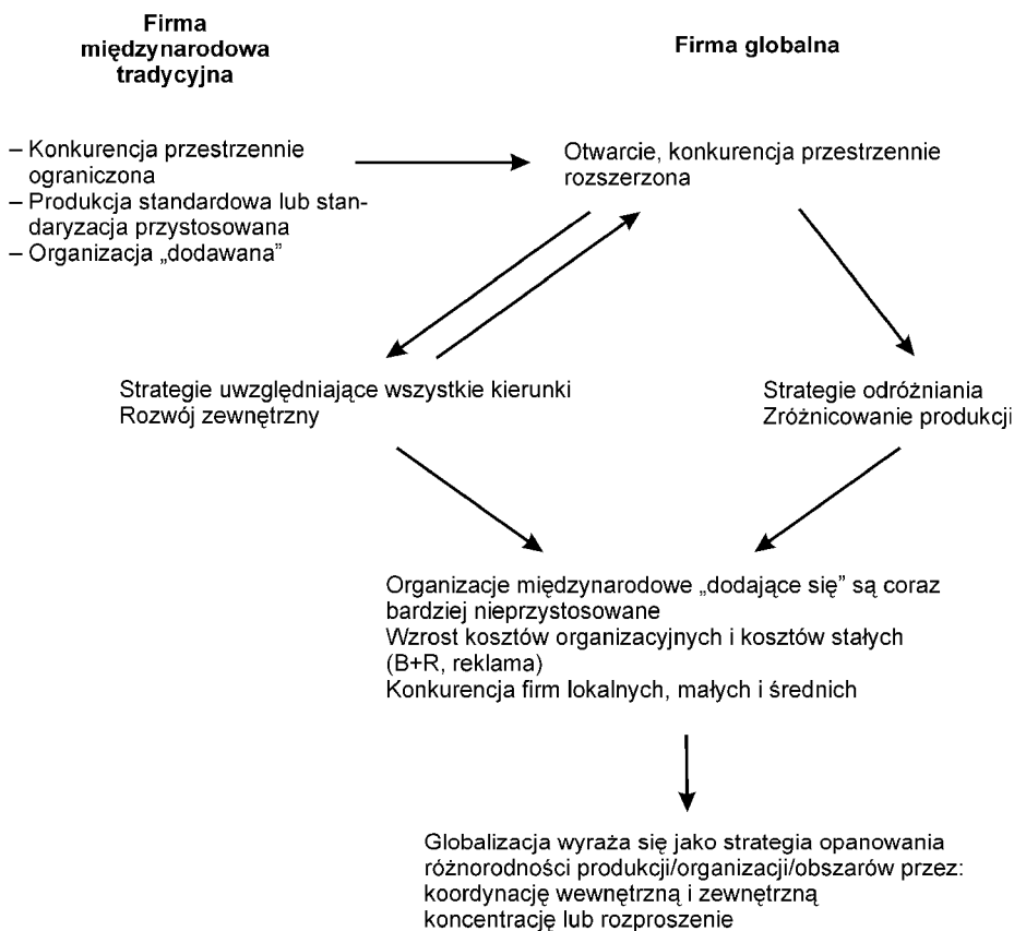
Rys. 2. Strategie i zachowania przedsiębiorstw międzynarodowych i globalnych

Proces przekształcania się tradycyjnych przedsiębiorstw o wielu lokalizacjach w firmy globalne prezentuje rys. 2.