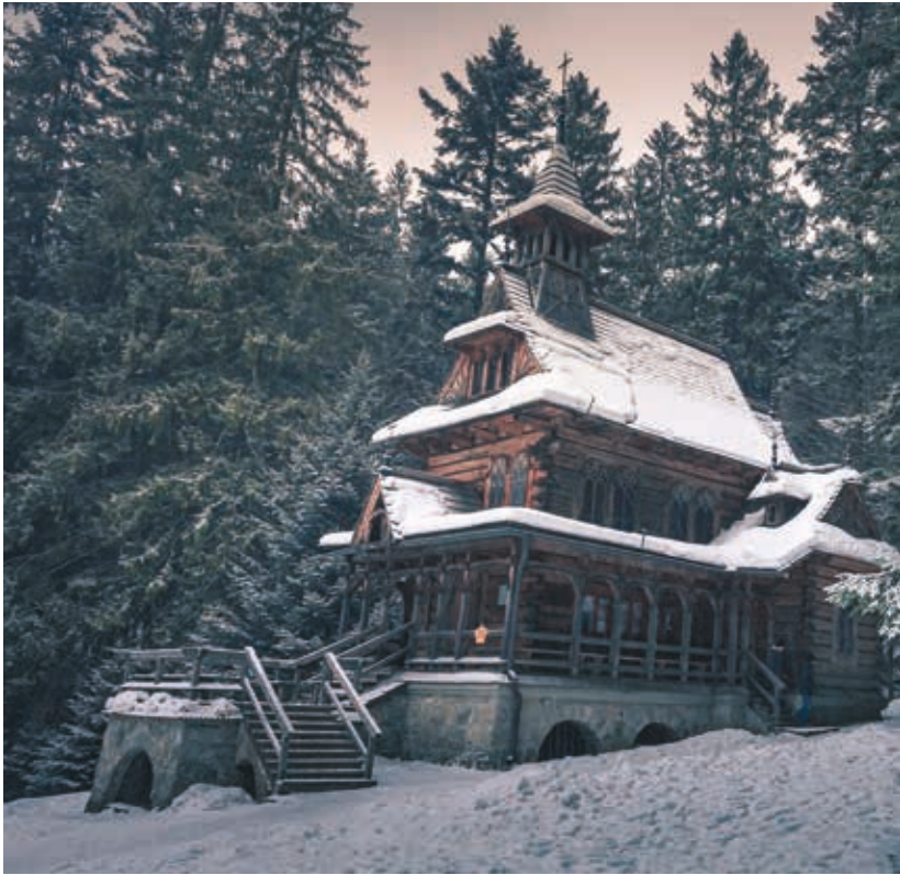
▲ Kaplica Najświętszego Serca Pana Jezusa na Jaszczurówce

50. XX w. w stylu nawiązującym do zakopiańskiego. Tutaj można znaleźć najtańsze noclegi w centrum Zakopanego.