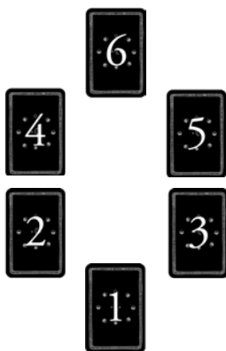
Ilustracja 1-3: Przebudzenie uśpionych energii