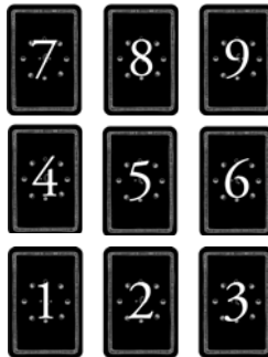
Ilustracja 1-4: Co cię woła