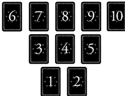
Ilustracja 1-2: Co się kryje głębiej