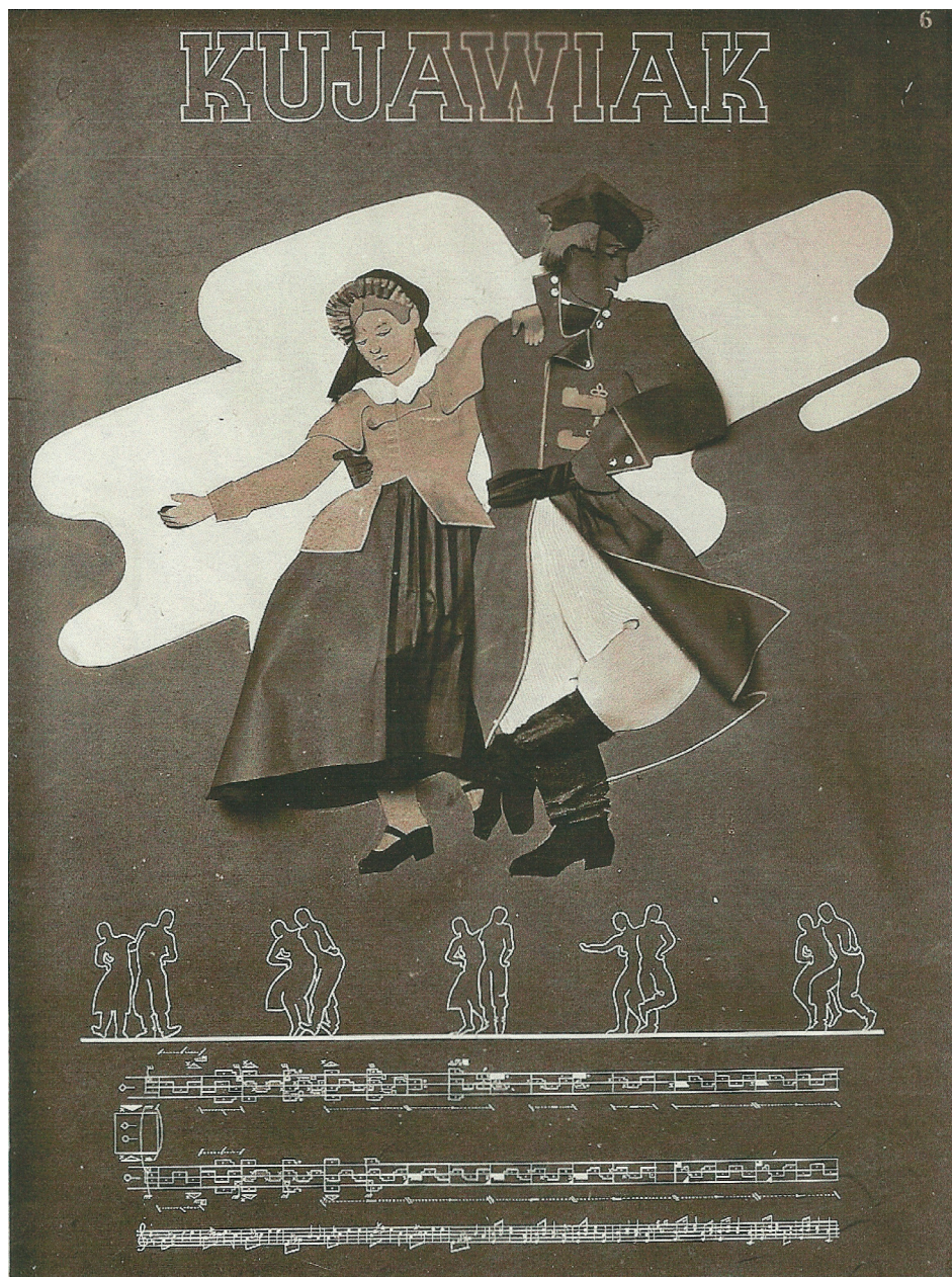
Ilustracja 33. Plansza prezentująca kujawiaka przygotowana na Międzynarodową Wystawę Tańców w Archives de la Danse w Paryżu w 1937 r.