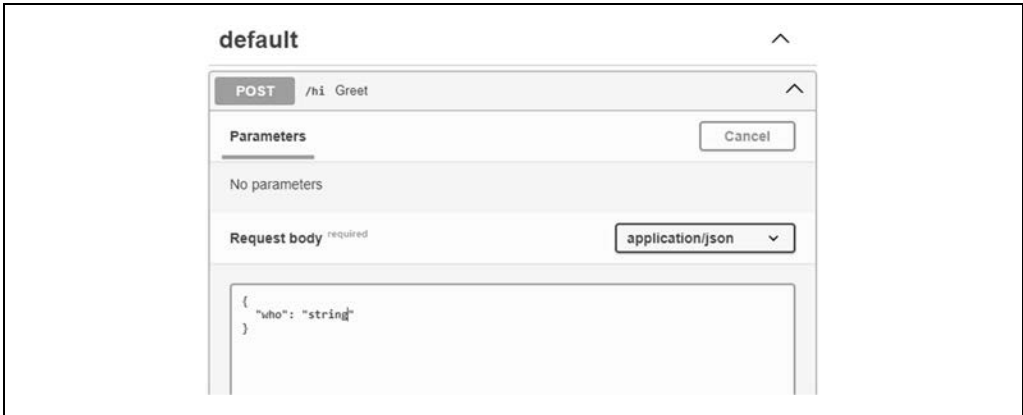
Rysunek 3.3. Okienko do wpisywania danych

Kliknij przycisk Try it out po prawej stronie. Pojawi się okienko tekstowe pozwalające na wpisanie wartości do ciała żądania (rysunek 3.3).