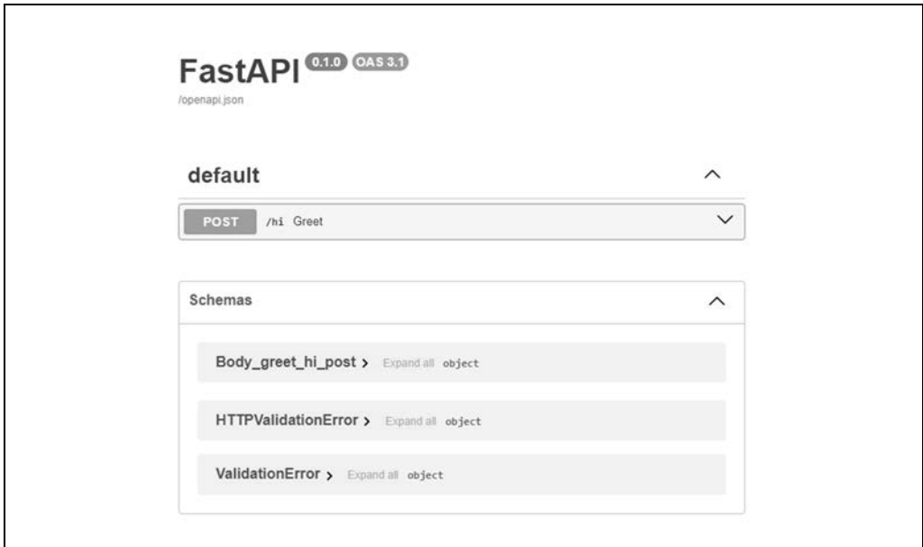
Rysunek 3.1. Wygenerowana strona dokumentacji

Zobaczysz coś podobnego do zrzutu ekranu z rysunku 3.1 (zrzut został przycięty tak, aby pokazywać tylko to, co istotne).