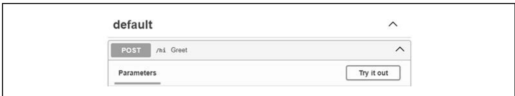
Rysunek 3.2. Otwarta strona dokumentacji

Kliknij strzałkę znajdującą się na prawym końcu zielonej ramki, aby otworzyć interfejs użytkownika do testowania (rysunek 3.2).