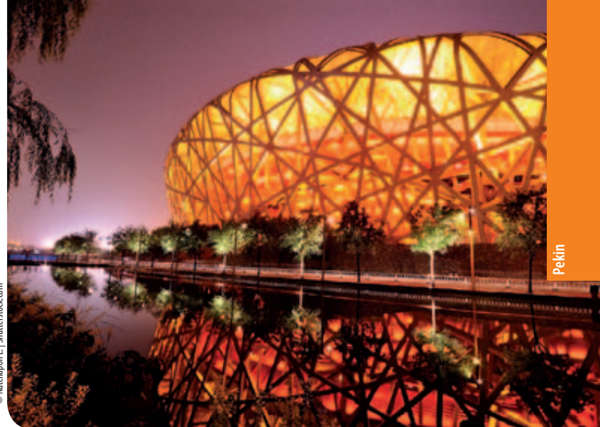
„Ptasie Gniazdo”, czyli Olimpijski Stadion Narodowy

Futurystyczny gmach pekińskiego Teatru Narodowego